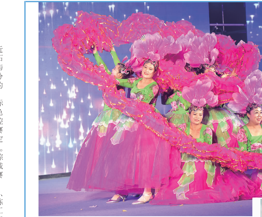
日前,东海县温泉镇举办“广场‘舞’风采 盛世迎国庆”文化活动,全县22支队伍表演了形式多样、活泼新颖的广场舞。