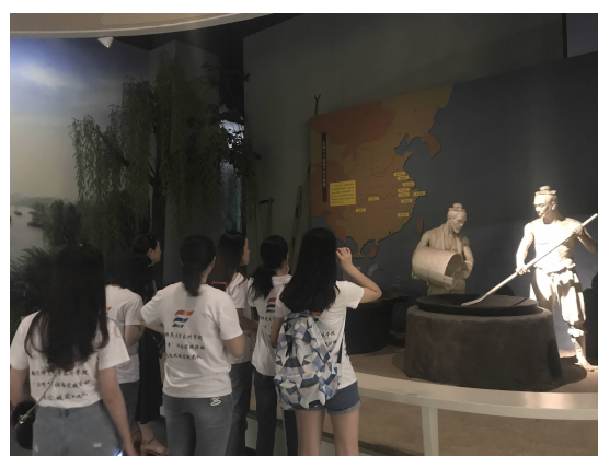
「走近凤城实践团队」 「访灵韵古城,赞魅力泰州」