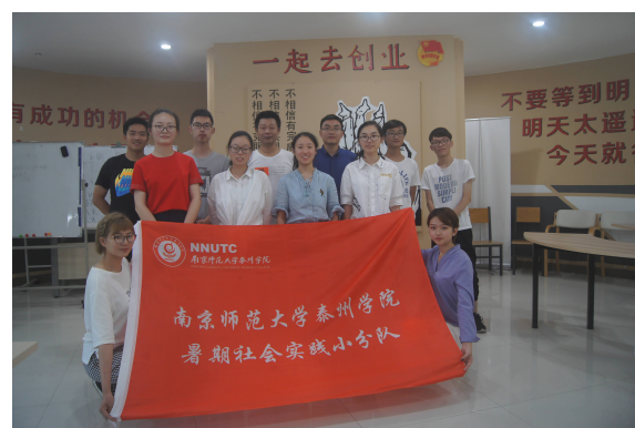
「飞越大学」高中—大学衔接 咨询服务团队