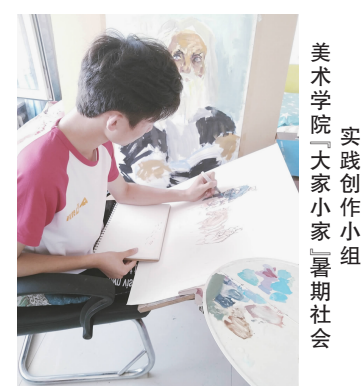
美术学院「大家小家」暑期社会实践创作小组