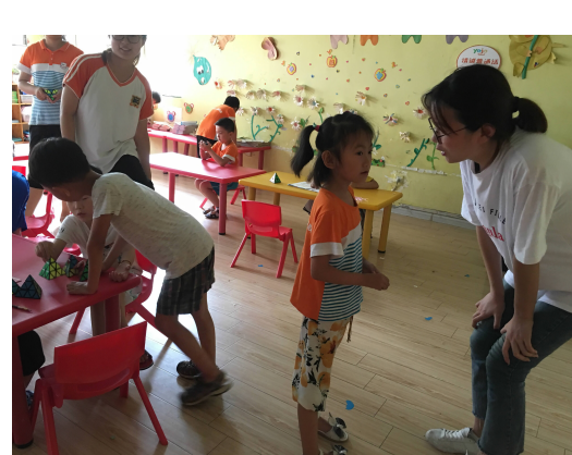
「学好英语,讲好新时代的中国故事」 暑期社会实践团队