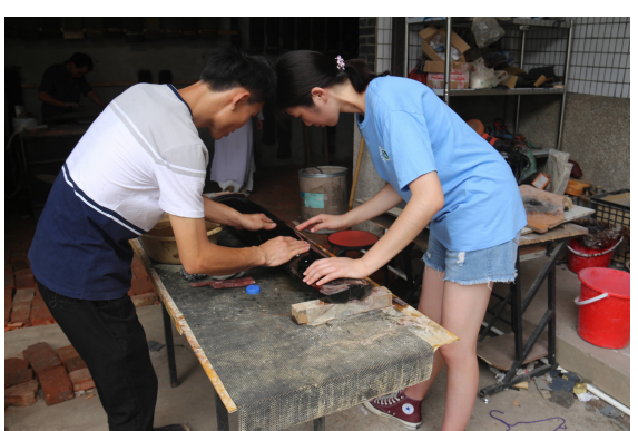
「寻琴记」古琴的前世今生」 实践团队