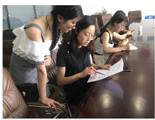
暨普法宣传暑期社会实践团队 「苏沪法治宣传」教育成果调研