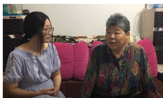
「时间旅行者」实践团队