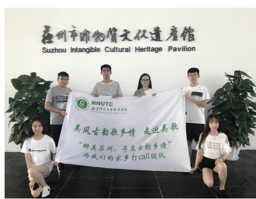
「醉美苏州」寻觅园艺「为我们的家乡打call」团队