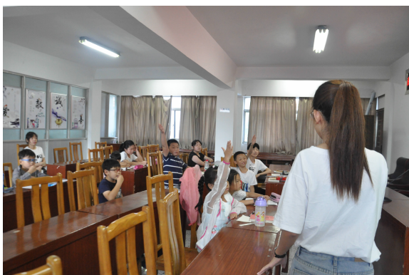
「麦田行动」暑期实践团队