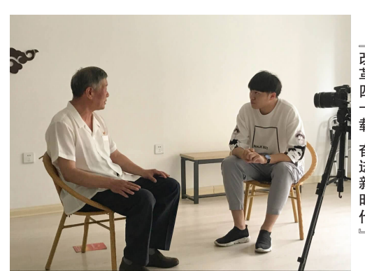
「改革四十载,奋进新时代」 实践团队