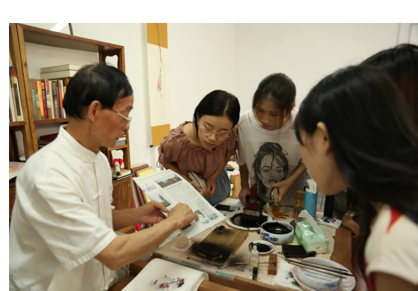
「印刷活化石」暑期实践团队