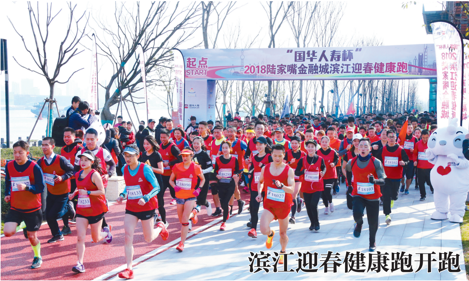
滨江迎春健康跑开跑

成审批程序,目前招标、审图等部门已提前介入提供服务。 “按照以往的做法,整个招标公告的时间要70天。这次通过对相关环节的有效衔接,整个过程缩短了10天。”新区建交委招标办相关负责人告诉记者,新的审批改革办法和“一次办成”的新平台的实施,不仅要求政府部门在审批流程上进行优化,各环节上进行无缝衔接,同时对建设单位和代建单位在政策、业务方面的熟悉程度也提出了更高要求。 将来,更多的企业投资项目将通过“一次办成”的新平台来办理,让企业申请审批的过程更方便,更好地改善营商环境。