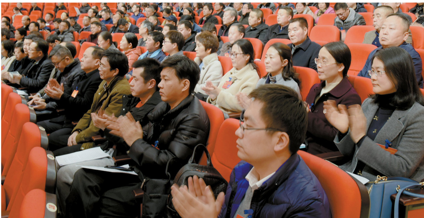
市政协十五届三次会议通过决议