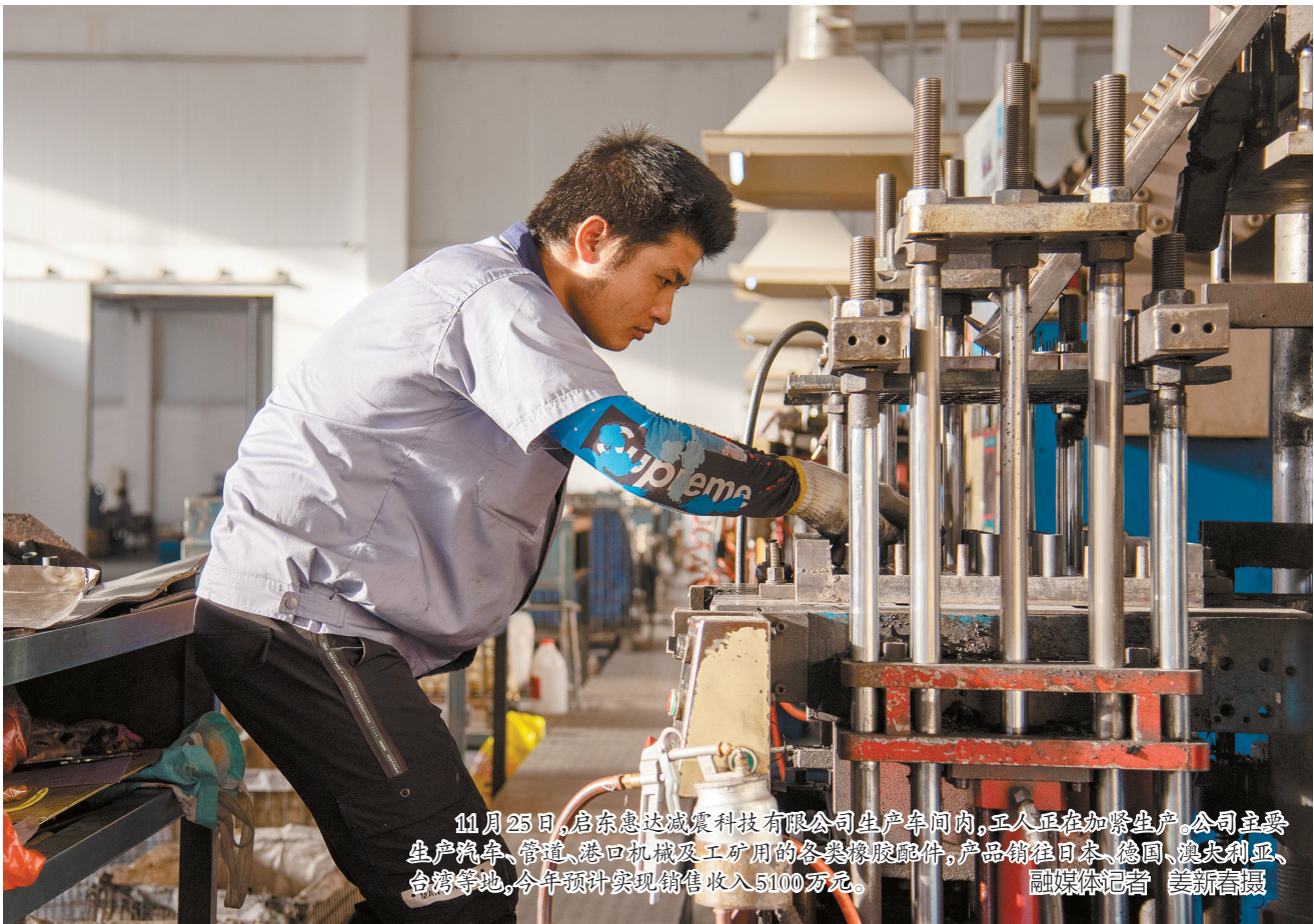
11月25日,启东惠达减震科技有限公司生产车间内,工人正在加紧生产。公司主要生产汽车、管道、港口机械及工矿用的各类橡胶配件,产品销往日本、德国、澳大利亚、台湾等地,今年预计实现销售收入5100万元。