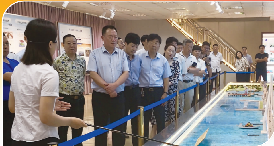
市政协常委会协商新城规划建设。