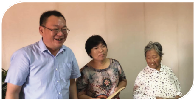
市政协主席张元健向白蒲镇单亲特困家庭发放政协慈善爱心款。

2. 服务重点工作推进。 一是积极参与招商引资。积极担当作为，市政协领导班子成员带头，机关同志群策群力，共同关注招商引资，及时提供项目信息。经科委赴浙江等地考察项目情况，协调落实项目选址，协助办理项目审批手续。全年上报确认项目信息8条，落地开工项目3个。二是积极参与重点工作督查。市政协班子成员经常深入挂钩联系镇、村及企业，推进重点工作。各位主席根据分工，牵头对全市农业、城建、社会事业等条线工作和污染防治攻坚行动进行重点督查，成立专项督查组，建立工作机制，强化民主监督。在污染防治攻坚督查中，市政协先后形成《全市污染防治督查报告》《突出环境问题整治督查报告》《长三角区域污染防治协作机制落实情况