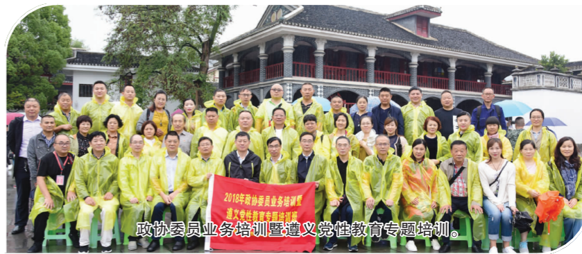
政协委员业务培训暨遵法党性教育专题培训。

4. 聚焦弱势群体，温暖民心。 全体政协委员继续传递善举，传承爱心，热心慈善公益事业，关心关爱弱势群体，充分彰显为民情怀和使命担当。全体政协委员参与捐资设立的“政协慈善爱心基金”组织开展了第二批捐赠活动，百名单亲家庭特困学生得到救助，共捐助爱心基金16.1万元；广大企业家委员积极参与社会捐赠，全年63名企业家委员捐款累计679.24万元，有14人捐款超过10万元。