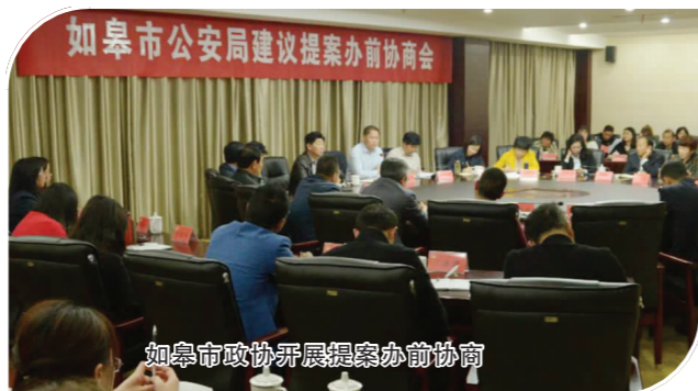
如皋市政协开展提案办前协商

市政协常委会坚持求真务实，凝聚创新发展的智慧和勇气，进一步深化协商民主建设，创新民主监督方式；深入挖掘文史资源，彰显资政优势，不断焕发出政协工作的生机与活力。