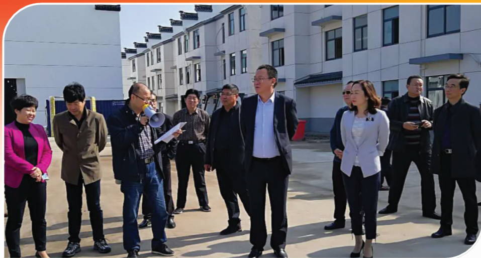
市政协常委会协商“国家全域旅游示范区”创建工作。