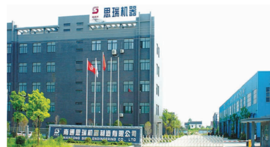
南通思瑞机器制造有限公司