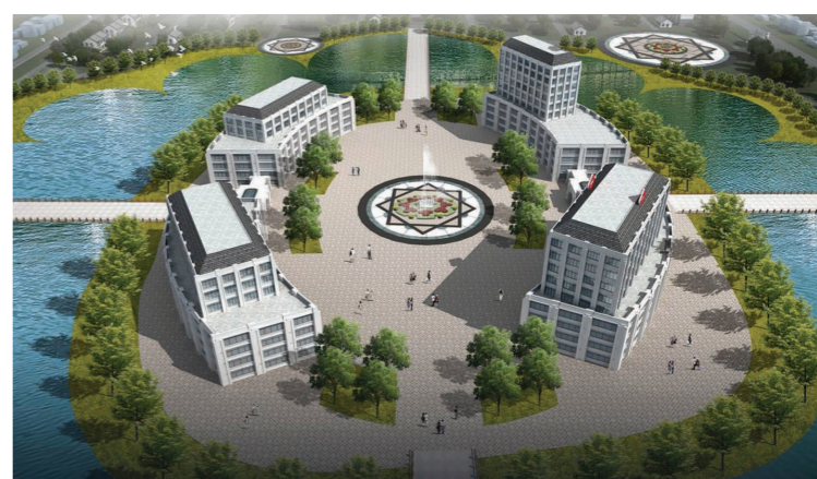
莲花岛生态养老庄园综合服务中心