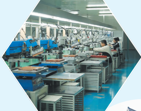
展志电子科技有限公司