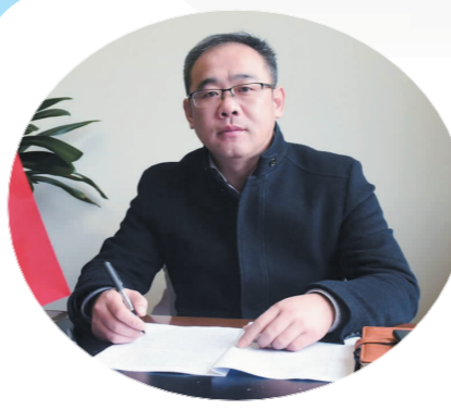
下原镇党委书记 柳杰军

一切过往皆为序章。2019年下原镇将在市委、市政府的坚强领导下，继续团结带领全镇干部群众，以“功成不必在我”的胸襟和“功成必定有我”的担当，接续开辟下原高质量发展新境界，以优异的新业绩向新中国成立70周年献礼。