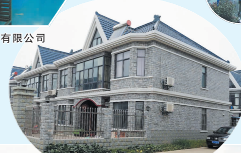
下原镇邹庄安置小区