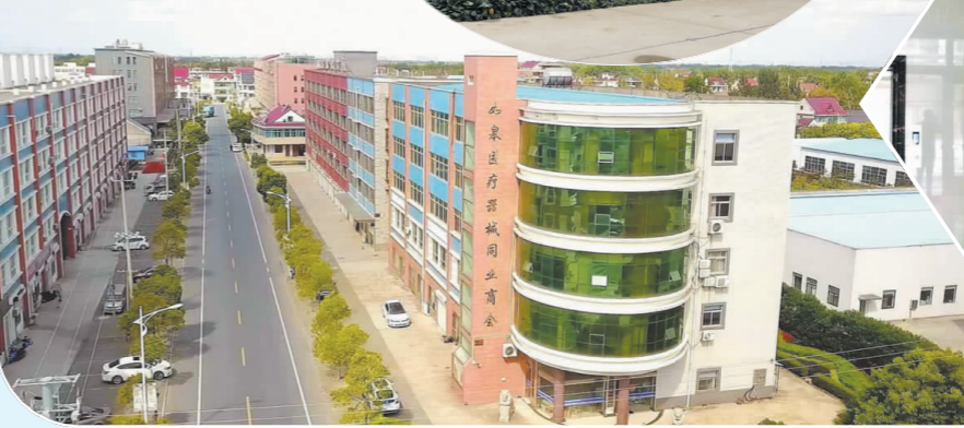
坐落于下原镇的如皋医疗器械同业商会