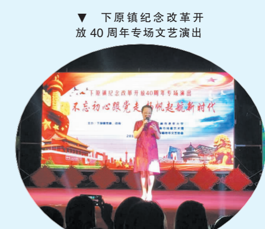
下原镇纪念改革开放40周年专场文艺演出