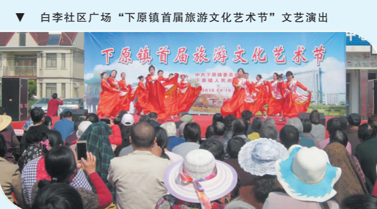
白李社区广场“下原镇首届旅游文化艺术节”文艺演出