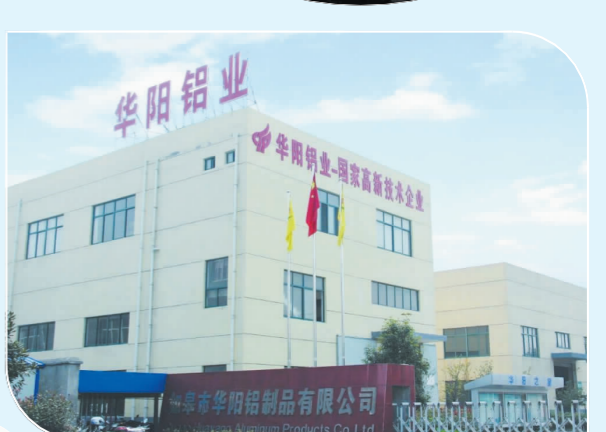
国家高新技术企业——华阳铝业