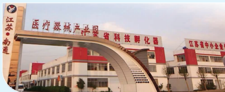
下原镇医疗器械产业园