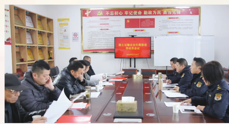
渣土运输企业扫黑除恶专项斗争再动员

为切实打赢扫黑除恶专项斗争，市城管局丰富宣传内容，拓展宣传载体，最大限度地发动群众，努力在全社会营造人人参与、家喻户晓的强大声势。 市城管局常态化开展“扫黑除恶”主题宣传活动，持续宣传专项斗争开展扫黑除恶专项斗争的重要意义、基本原则、目标任务等；充分利用“如皋城管”官方微博、微信公众号等媒介，大力宣传“扫黑除恶”的文件精神，依托“城管进企业”“城管进社区”平台，动员沿街商户利用LED显示屏播放扫黑除恶专项斗争宣传语218条，在建渣道土运输企业、便民疏导点以及物业公司播放标语324条，张贴通告431张，发放宣传资料2000余份，深入企业宣传相关法律法规20余次。 同时，主动提供法律援助，针对城市管理工作中诸如小摊小贩、无业人员、贫困对象等弱势群体，在涉及行政处罚案件等需要法律援助时，耐心宣传引导，及时化解矛盾，防止被黑恶势力教唆操控，确保扫黑除恶专项斗争取得实实在在的成效。