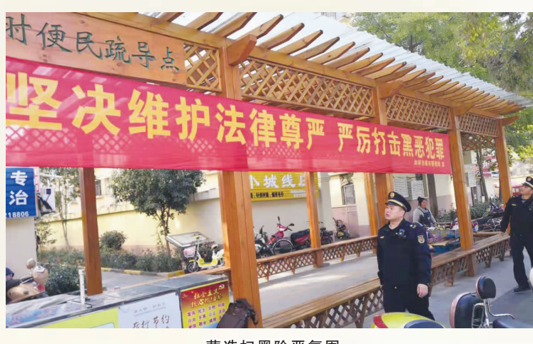
营造扫黑除恶专项斗争氛围

为切实打赢扫黑除恶专项斗争，市城管局丰富宣传内容，拓展宣传载体，最大限度地发动群众，努力在全社会营造人人参与、家喻户晓的强大声势。 市城管局常态化开展“扫黑除恶”主题宣传活动，持续宣传专项斗争开展扫黑除恶专项斗争的重要意义、基本原则、目标任务等；充分利用“如皋城管”官方微博、微信公众号等媒介，大力宣传“扫黑除恶”的文件精神，依托“城管进企业”“城管进社区”平台，动员沿街商户利用LED显示屏播放扫黑除恶专项斗争宣传语218条，在建渣道土运输企业、便民疏导点以及物业公司播放标语324条，张贴通告431张，发放宣传资料2000余份，深入企业宣传相关法律法规20余次。 同时，主动提供法律援助，针对城市管理工作中诸如小摊小贩、无业人员、贫困对象等弱势群体，在涉及行政处罚案件等需要法律援助时，耐心宣传引导，及时化解矛盾，防止被黑恶势力教唆操控，确保扫黑除恶专项斗争取得实实在在的成效。