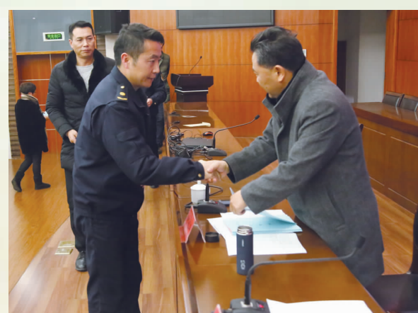
签订扫黑除恶专项斗争承诺书

市城管局牢固树立“一盘棋”的思想，既各司其职、依法履职，又通力协作、密切配合，形成齐抓共管、合力攻坚的工作局面。成立领导小组，强化组织保障。成立扫黑除恶专项斗争领导小组，设立领导小组办公室，与各科室、下属单位负责人签订目标责任书，并把扫黑除恶专项斗争纳入月度工作计划以及年终绩效考核内容，形成“局主要领导负总责，分管领导具体负责、相关科室责任包干”的工作格局。 完善工作机制，强化制度保障。完善信访工作机制，畅通投诉举报渠道；建立信息报送机制，实行重大信息及时报和信息月报制度；建立线索移交机制，对业务范围内和日常执法检查中发现的涉黑涉恶线索，及时向领导小组办公室、公安机关及有关部门进行移交。 组织督导检查，强化措施保障。对开展“扫黑除恶”工作不力的，实行责任倒查，严肃问责，防止行政不作为和乱作为。严格杜绝城管系统党员干部和执法人员为黑恶势力提供庇护，消除黑恶势力滋生土壤，维护社会和谐稳定。