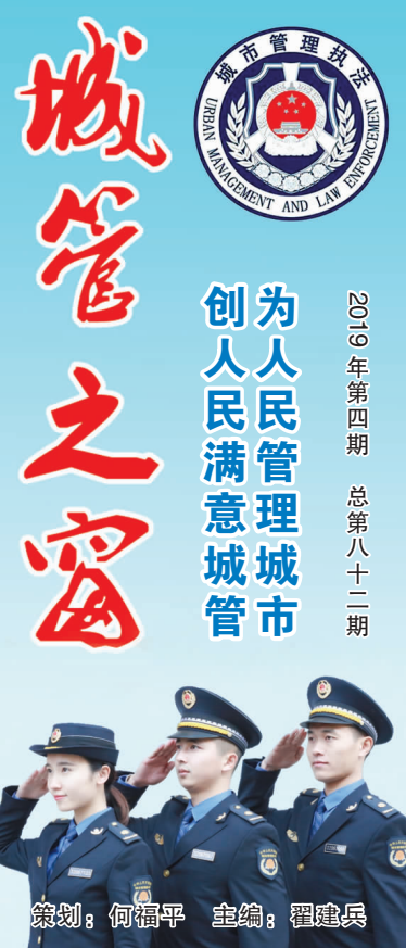
创为人民满意城市