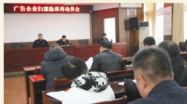
广告企业扫黑除恶专项斗争再动员

市城管局坚持立足职能、主动靠前，将扫黑除恶专项斗争融入日常城市管理工作中，全面加强和相关部门的协作配合，凝聚工作合力，增强打击效果。梳理黑恶线索，突出摸排在违法建设治理、流动摊点管理、露天烧烤整治、生活噪音整治、非法倾倒垃圾、环卫作业市场化招投标、环卫作业日常监管、生活垃圾填埋场营运、建筑垃圾运输处置、小区物业管理招投标等方面是否存在涉黑涉恶现象，梳理涉黑涉恶线索，建立扫黑除恶专项斗争台账，做到心中有数、目标清晰。 突出打击重点。紧盯“12类打击重点”，重点检查辖区各项工作，坚决做到“黑恶必除、除恶务尽”，有力打击黑恶犯罪，净化社会治安环境。同时，加强外部联动。针对群众反映强烈的新疆籍人员露天烧烤不配合管理的问题，联合环保、市场监管、民宗、公安、检察院、法院多次召开座谈会、会商会议，将矛盾消除在萌芽状态。目前，市区4个新疆籍人员烧烤摊点已全部入室经营。