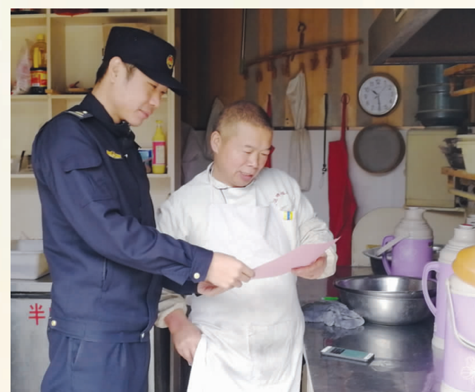
进商铺宣传扫黑除恶专项斗争知识