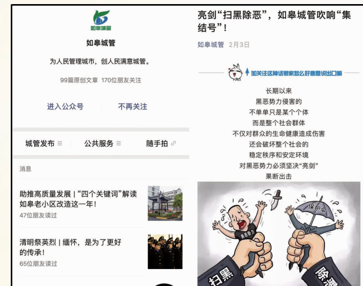
“如皋城管”微信开设专题宣传