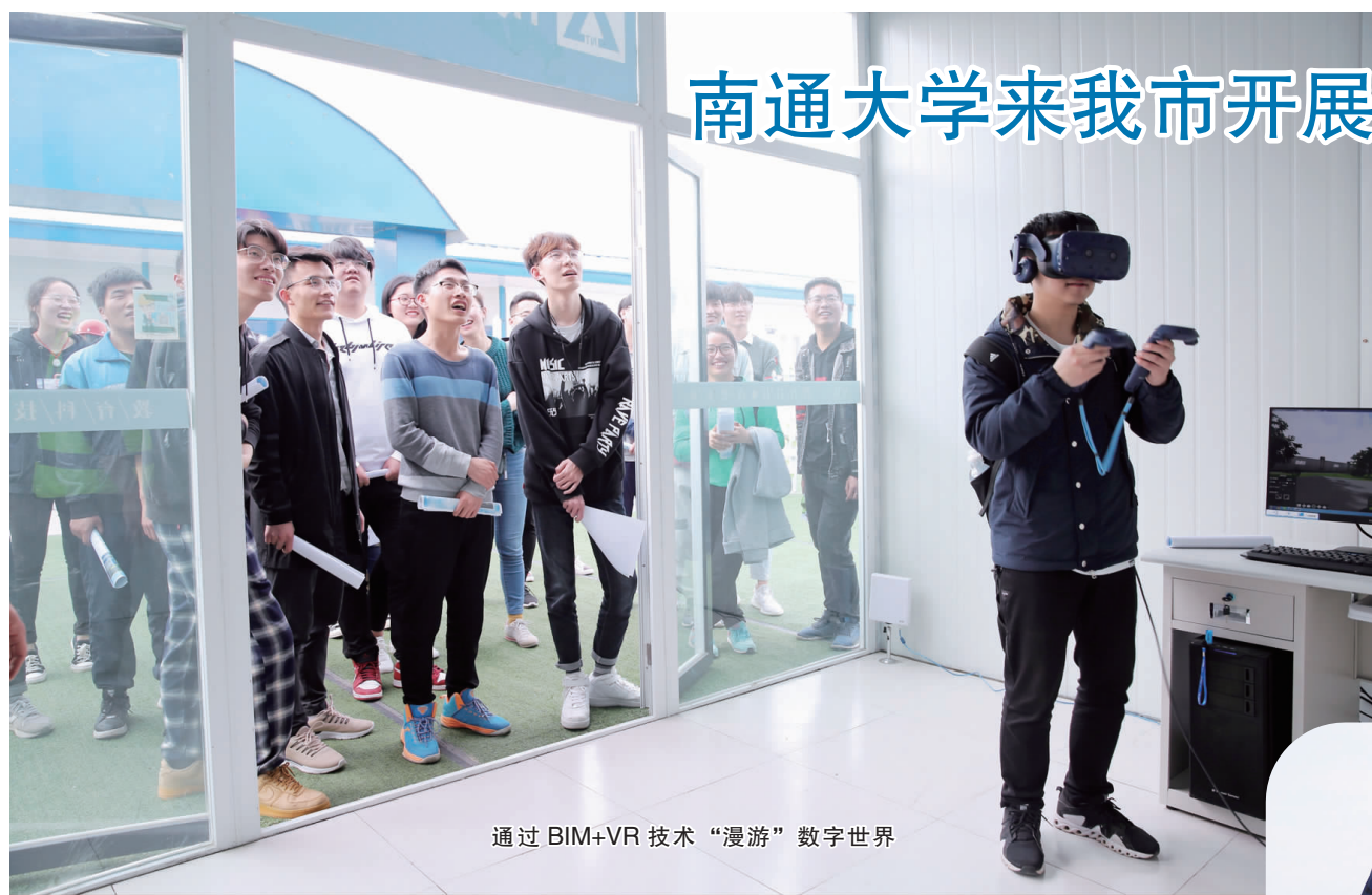
通过BIM+VR技术“漫游”数字世界

近日,来自南通大学杏林学院、交通与土木工程学院的47名大学生来我市开展产学研交流活动。学生们参观了南通六建荣誉室及BIM公司,观看了南通六建BIM技术应用视频。当天下午,学生们参加了南通生活垃圾填埋场七号填埋池项目开放日活动。