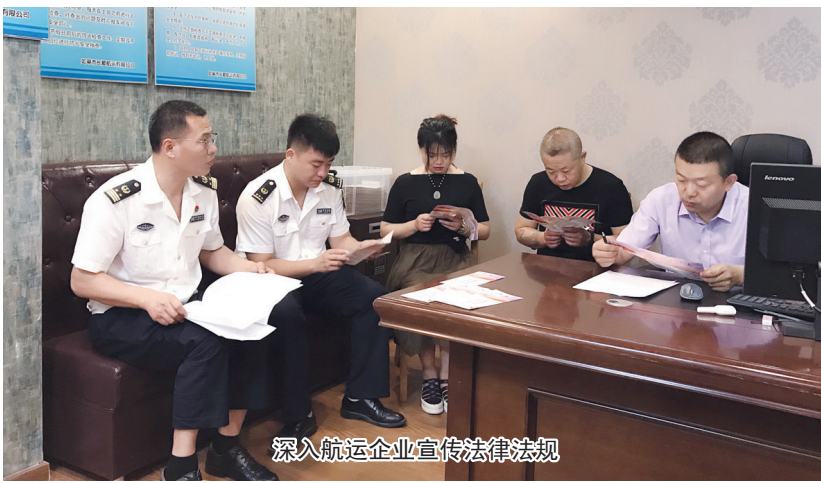
深入航运企业宣传法律法规

加强应急值守,一旦发生事故或险情,确保在第一时间进行应急处置。6月17日下午,连申线焦港大桥北侧,一艘满载400吨出口大米的船舶与相向行驶的船舶发生碰撞而横倾,