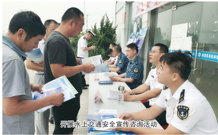
开展水上交通安全宣传咨询活动

本报讯(通讯员鞠丽娟)6月16日,市交通运输局组织市地方海事处、市交通运输综合行政执法大队、南通港航发展中心如皋分中心等部门在焦港船闸上游远调站设立了宣传咨询点,向涉水企业和船民群众宣传相关法律法规,提供安全咨询服务。 活动当日,宣传咨询点共发放水上交通安全宣传资料160多份,接受涉水企业和船民现场咨询40多人次。执法人员向涉水企业和船民宣传《安全生产法》《水污染防治法》《航道法》和即将实施的《江苏省水路交通运输条例》等法律法规,结合水上重特