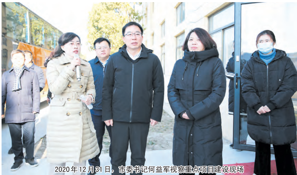
2020年12月31日，市委书记何益军视察重点项目建设现场