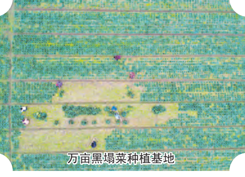
万亩黑塌菜种植基地