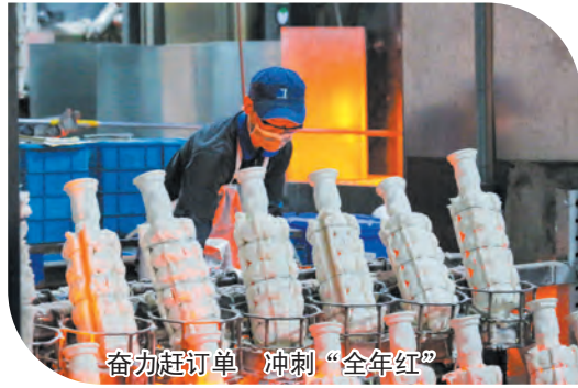
奋力赶订单 冲刺“全年红”