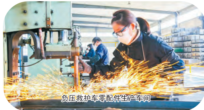
负压救护车零配件生产车间

池桥、丰收河桥3座交通桥。搬经消防站即将建成运行，镇区污水处理厂投入运行，武穆变电所基本建成，3家自来水厂完成回购。城市管理更趋精细。引导300个占道摊点就近入街便民疏导点，拆除安全隐患广告243处，拆除违法建筑19处。完善镇村垃圾处理市场化运作机制，全面推广垃圾分类收集和统管直运，新建成常青垃圾中转站，镇区垃圾中转站加速更新，实现生活垃圾日产日清。