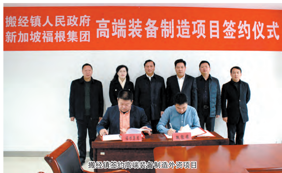
搬经镇签约高端装备制造外资项目