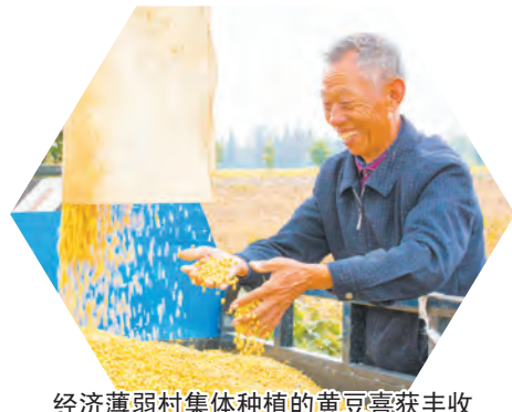
经济薄弱村集体种植的黄豆喜获丰收