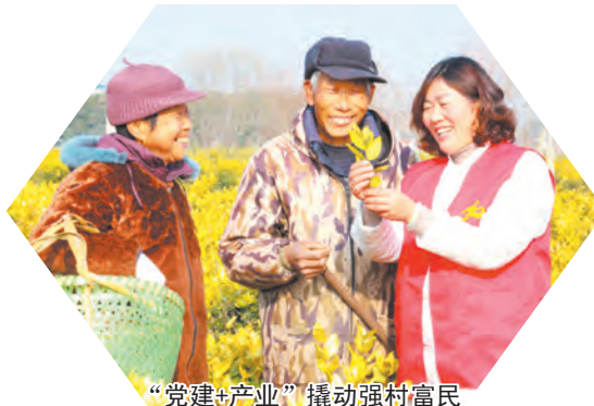
“党建+产业”撬动强村富民

亩，位居全市首位。项目建设态势强劲。从紧从快推进项目建设，强化项目建设“开竣工”全流程服务，全年新开工海泰科特一期、兰佛卡等亿元项目5.5个，竣工高泰磨具、元生酒业等亿元项目5个，转化群辉门窗、泉锦纺织等亿元项目6个，办结“农转用”项目用地40亩。助企纾困精准有效。坚持“围墙外包办，围墙内帮办”的理念，常态化开展银企对接、产销对接、产学研对接活动，为制造业企业累计融资超1.8亿元，增加订单销售3000余万元。建立用工保障机制，保障企业用工需求，为35家重点企业对接产业工人538人。