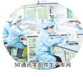
5G通讯零部件生产车间