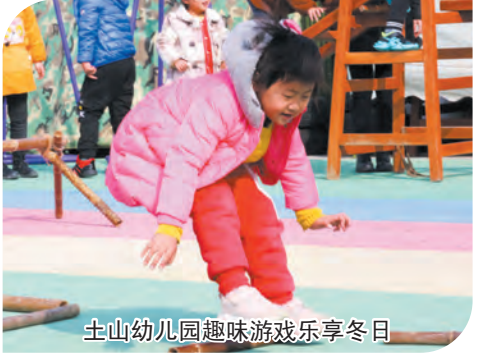
土山幼儿园趣味游戏乐享冬日