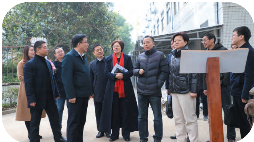
中国科学院院士朱美芳回访母校江苏省石庄高级中学