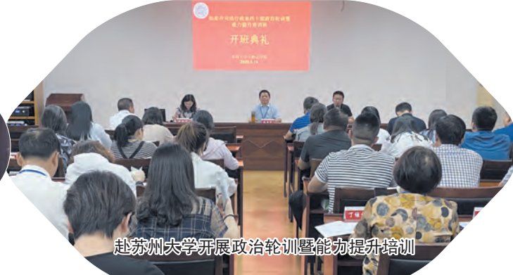
赴苏州大学开展政治轮训暨能力提升培训