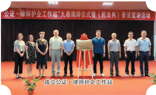
成立公证·律师护企工作站