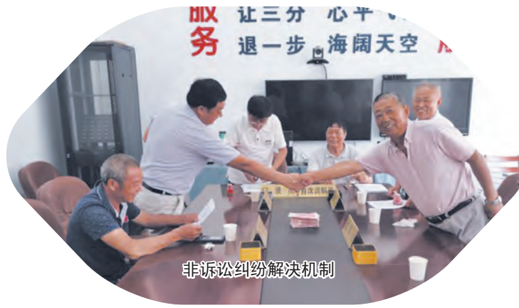
非诉讼纠纷解决机制

开展“学习苏州‘三大法宝’，答好南通‘发展四问’”，推动如皋高质量发展”专题学习研讨，举办干部政治轮训暨能力提升培训。推动市政府出台《关于加强律师队伍的意见》，设立300多万元财政保障资金，推出多项激励措施。市公共法律服务中心被表彰为全国公共法律服务先进集体。涉企矛盾纠纷人民调解委员会被表彰为全国模范人民调解委员会。我市助推刑事和解工作高质量发展在全省刑事和解平台启动仪式上交流发言。法律援助服务标准化建设被省委依法治省办评为“全省法治惠民实事优秀项目”。“以标准化建设为指引提升法律援助服务水平”被评为南通市2019年度政法领域全面深化改革优秀案例。