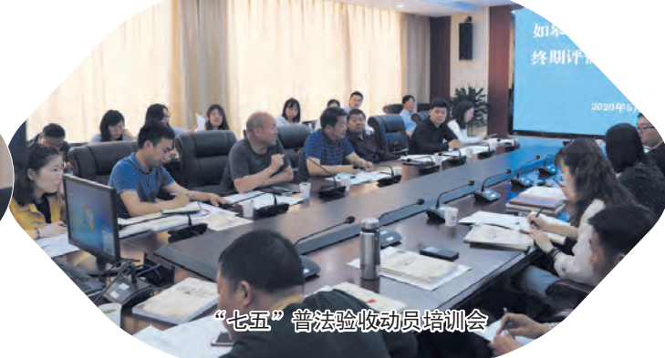
“七五”普法验收动员培训会