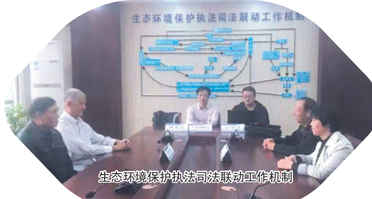
生态环境保护执法司法联动工作机制