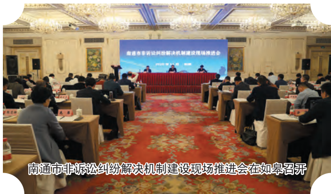
南通市非诉讼纠纷解决机制建设现场推进会在如皋召开