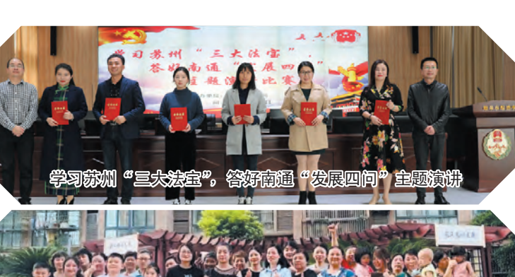
学习苏州“三大法宝”，答好南通“发展四问”主题演讲