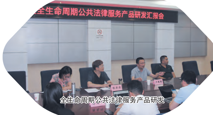
全生命周期公共法律服务产品研发