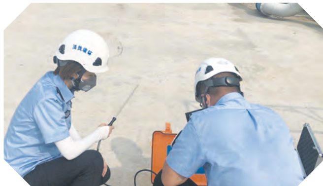
环境质量监测现场