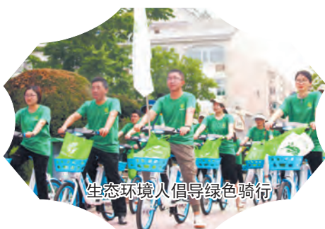
生态环境人倡导绿色骑行

全力推进净土保卫战。 开展重点行业企业用地土壤污染状况详查。筛选出涉及化工、金属表面处理、危废处置、生活垃圾填埋等领域内的45家土壤污染重点监管单位，督促开展土壤和地下水自行监测、隐患排查，履行土壤污染防治主体责任。组织开展土壤污染防治专项执法检查，全面排查环境问题，及时督促整改落实。通过企业自查、镇（区、街道）普查，邀请专家开展联合复查，查找发现环境、安全隐患，并督促整改。推动化工企业的危废去库存工作，督促关停化工企业安全处置残留危废，全年未发生重大环境安全事件。