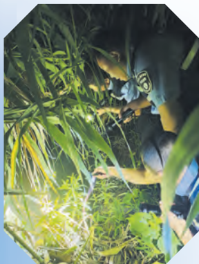
生态环境执法夜查

强化环境风险防控。 开展化工企业整治提升。积极开展化工企业安全环保整治提升工作，全面梳理化工企业的环境问题，形成“一企一策”整治意见，逐企交办，并督促整改落实。对列入2020年关停的34家化工企业，强化环境执法监管，督促企业制定规范的拆除方案，配合做好“两断三清”工作，防范环境风险。开展污染防治设施隐患排查。对全市范围内所有污染防治设施开展拉网式检查，排查污染防治设施安全风险隐患，压实企业主体责任，形成问题清单，落实企业逐一整改。健全环境风险防控措施，增强全社会环境安全意识，提高环境风险防范管理水平，有效防范和遏制重特大突发环境事件发生。