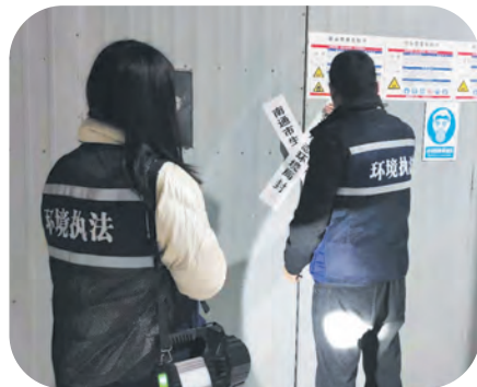
环境执法检查封现场