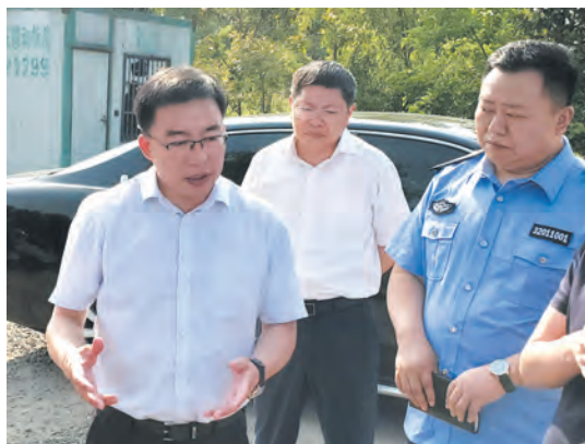
市领导督查生态环境