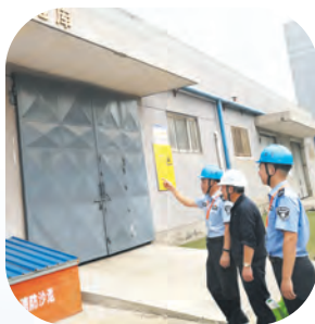
危废管理精准服务