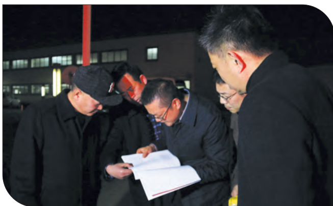
核查企业排污情况

案件，损害方缴纳生态损害赔偿金达100多万元。强制推行环境信用体系建设，1000多家企业纳入省环境信用评级管理，14家企业入选南通首批环保示范性企业。积极服务企业信用营商环境，全市46家企业实施环保信用修复。强化污染攻坚氛围营造，2020年10月份，《人民日报》和新华社等中央及省级新闻单位记者汇集长江镇，集中采访如皋生态“绿岛”阳鸿石化洗舱项目，强势宣传如皋生态文明建设亮点成效。