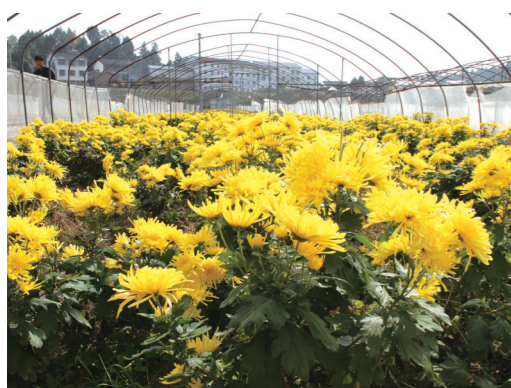
育苗棚里金源皇菊竞相绽放