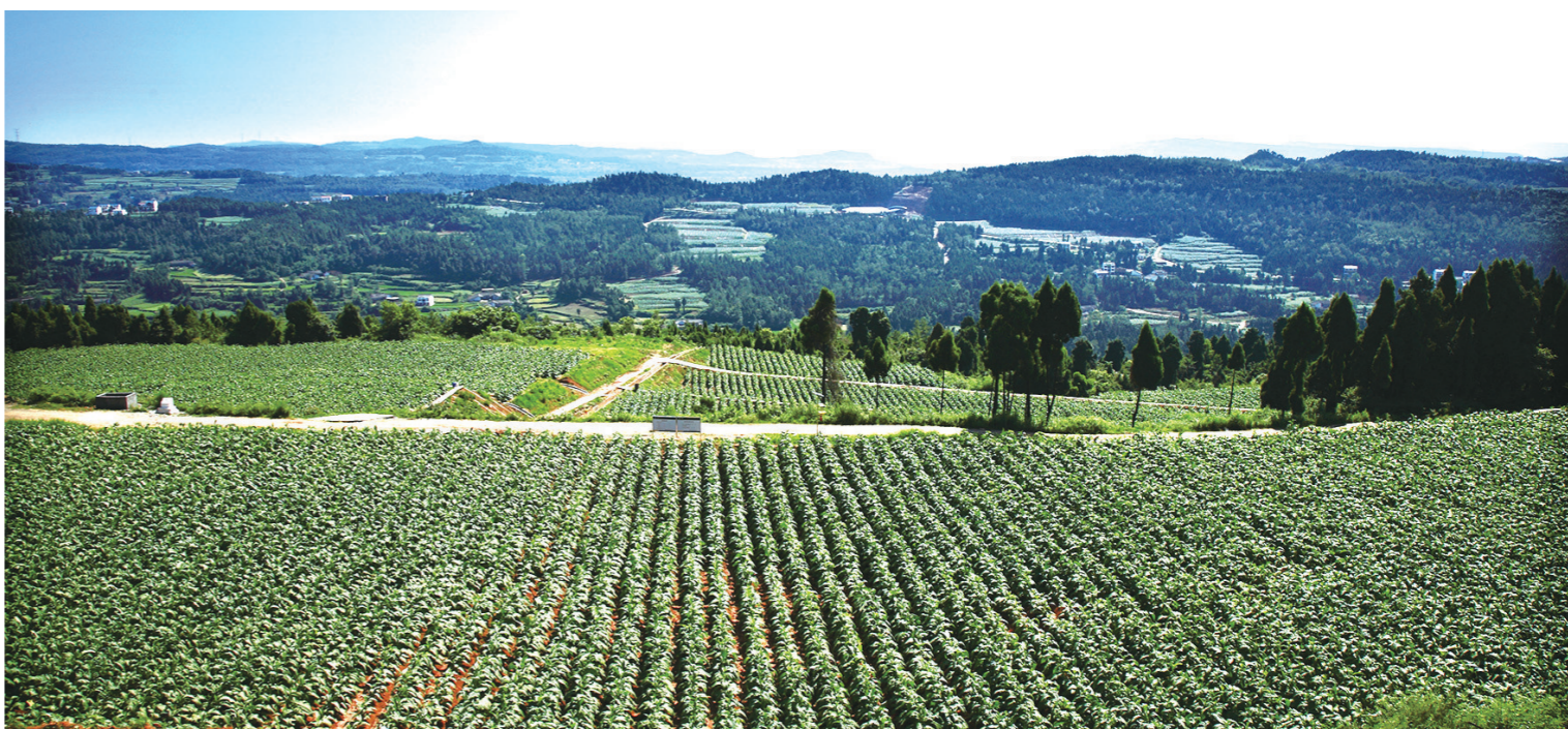
剑阁县高观乡张帽村生态烟区