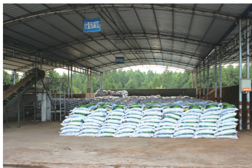
昭化区金源烟叶合作社集中发酵生产有机肥