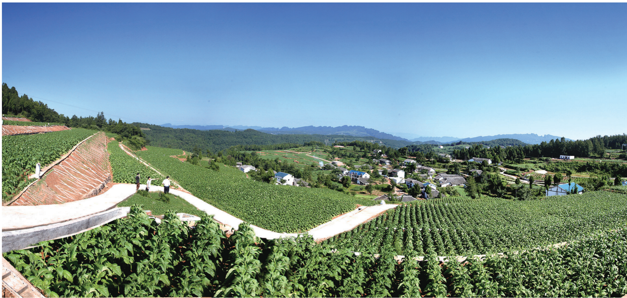
配套完善的基地单元

得益于广元烟草人艰辛却富有成效的探索,在规模逐年下降的背景下,广元烟区烟农户均总收入却从2012年的4.05万元稳步提升到2018年的6.79万元。