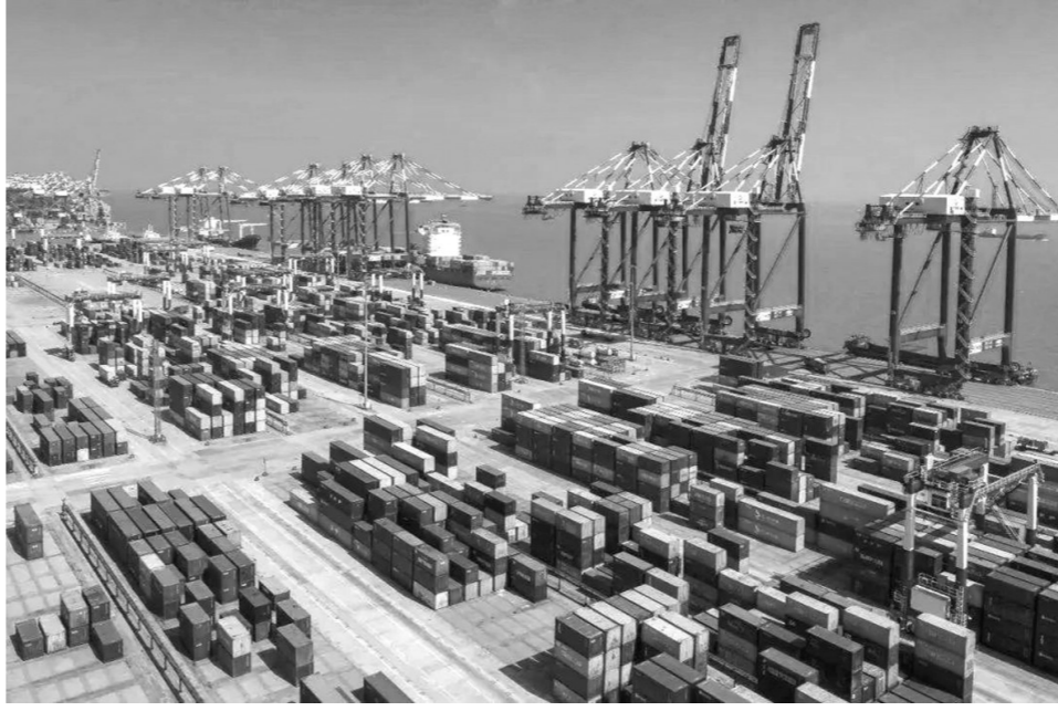
今年前4个月我国货物贸易进出口总值比去年同期增长4.3% (资料图)

最强大的压舱石,在于党中央的坚强领导、科学决策。英国《金融时报》援引摩根大通观点说:“最近的数据表明,(中国)政府稳定经济的政策正在起效。”从宏观看,我国宏观