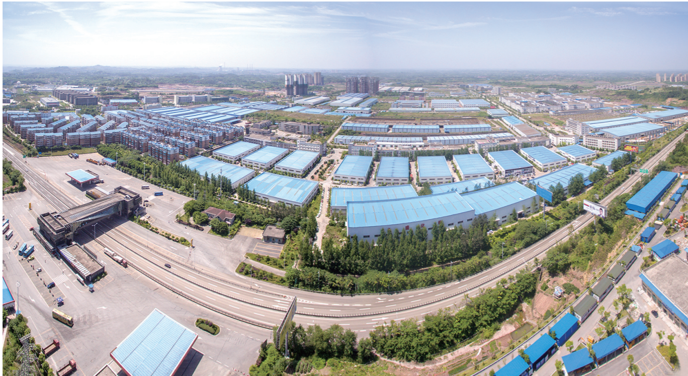
内江经开区全景图

GDP、服务业增加值、建筑业增加值等6项主要指标保持高速增长，高于好于全国全省全市平均水平，发挥了全市经济发展示范引领作用和“引擎作用”……过去一年里，内江经开区紧扣“产业项目重点推进年”安排部署，砥砺前行，一年的努力换来了沉甸甸的收获。