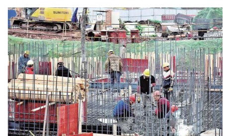
胜利·光耀城项目建设现场