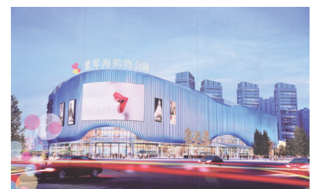
爱琴海购物公园效果图

东风浩荡扬帆春，万里征程催人急。在2020决胜全面小康关键之年，内江高新区将立足高新定位，依托高铁、高校等优势资源，重点实施“产业项目提升年”，加快构建现代产业体系，加快统筹推进城乡融合发展，加快营造良好发展环境，推动内江高新区经济高质量发展。(毛春燕 李玖)