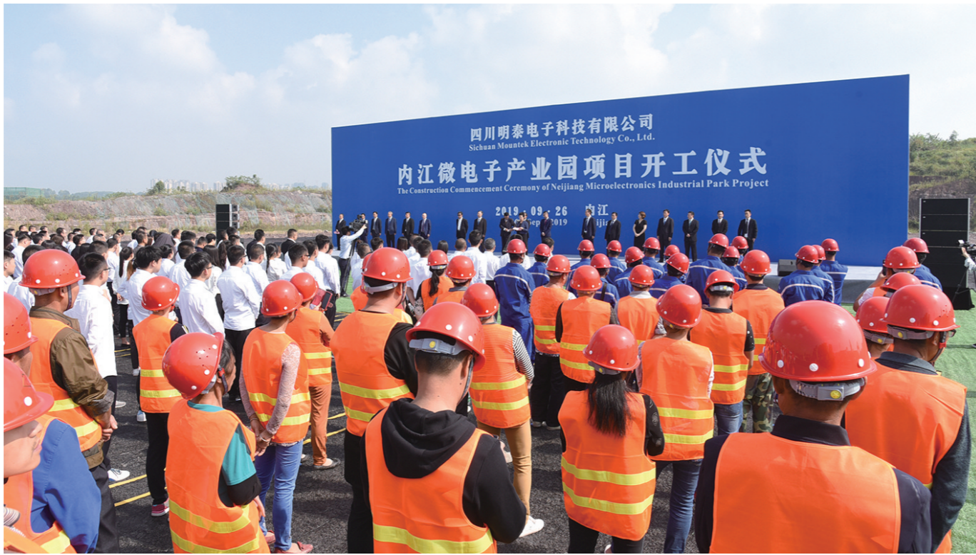
内江微电子产业园项目开工

过去的一年，内江高新区紧紧围绕全市“产业项目重点推进年”和全区“一年打基础、二年上台阶、三年新跨越”奋斗目标，团结带领全区干部职工立足实际、迎难而上、务实创新、埋头苦干，全力建设全省一流科技创新、产城融合和人才集聚的国家高新技术产业开发区，推动高新区“二次创业”取得新进展。