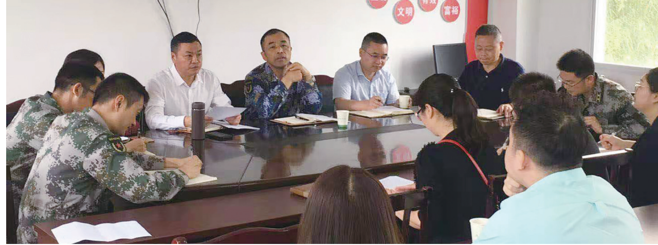
牛口桥村脱贫攻坚推进会

岁末年初，位于内江市中区凌家镇牛口桥村的大棚基地内，前来采摘草莓的游客络绎不绝，村民的脸上都洋溢着丰收和节日的喜悦。近年来，牛口桥村通过流转土地、发展产业、务农务工、承接公益性岗位等多种方式，先后摆脱贫困，走上了致富奔康路。