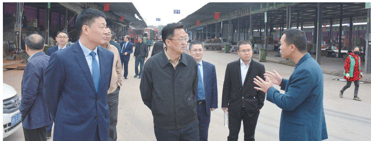
走访调研企业发展

2019年，乐山市商业银行内江分行在人民银行内江市中心支行和内江银保监分局的监督管理下，在上级行的坚强领导下，积极贯彻国家货币政策，积极响应内江市委、市政府号召，围绕内江“四新一大”及绿色环保等产业，充分发挥城市商业银行特色优势，大力支持地方民营经济和中小微企业发展。