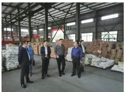
走访调研企业发展