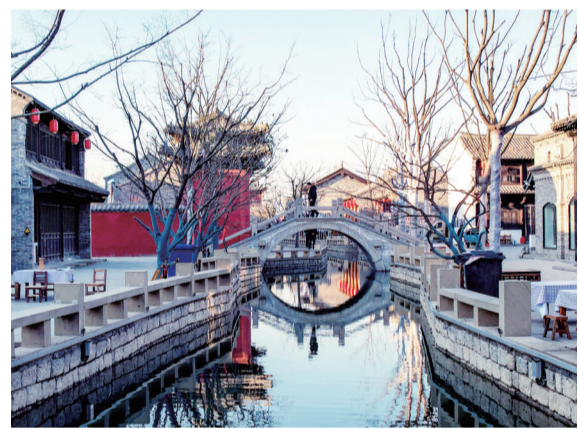
袁家村·宿迁印象水街

追寻味蕾上的鲜美,亦是一场追赶春天的浪漫。从市区出发,一路向东,只要十多分钟车程,便可以来到了袁家村·宿迁印象。袁家村坐落在宿迁市宿豫区杉园景区内,这里也是朱瓦集的旧址。蜿蜒的水街,高拱的石桥,灰墙黛瓦的古建筑,比肩林立的作坊店铺,给你走进江南小镇的时空感。春意融融,踏着青石板铺就的小路,顺着古朴典雅的小巷,一家家店铺,一家家作坊逛过去,尽情体验市井文化。最不能少的,就是可以一路逛、一路吃。这里汇聚着天南地北的各色小吃,再挑剔的人到这里,总有几款小吃会诱惑着你的味蕾。当然,正宗的陕西肉夹馍、甑糕、马蹄糕,地道的宿迁小吃酱豆炒鸡蛋、擀面皮、山楂糕,一定要尝一尝。兴致高涨时,还可以走进作坊,体验推石磨、和香油、点豆腐的乐趣。biang字不会写?跟着卖biangbiang面的老板娘学两遍顺口溜,再烦琐的biang字包你会写……走累了,还可以到朱家茶馆要上一壶茶,几样茶点,听一听外面戏台上正在演唱的地方戏曲。此时的惬意和满足,用“人间烟火气,最抚凡人心”这句话来表达,可谓妥帖。登高望远,站到城楼上,袁家村客栈、小吃作坊等尽收眼底,万亩荷园、鹭鸟翻飞的杉林与之遥相呼应,衬托出这个古朴村落的幽静和闲适。待到荷叶田田、荷花绽放时,这里又会是怎样的一种美呢?街灯亮起时,再来逛一次吧。流光溢彩的水街会给你另一种浪漫,和爱人并肩漫步,或赏景,或悄悄情话,或品尝美食。烟雨迷蒙时,这里也是不错的选择。高拱桥上发发呆,点数脚下的青石板,享受雨巷的宁静。说不定,在这里,还能邂逅“那位撑着油纸伞的姑娘”。生活不在别处,当下就是全部,一半是诗意,一半是烟火。