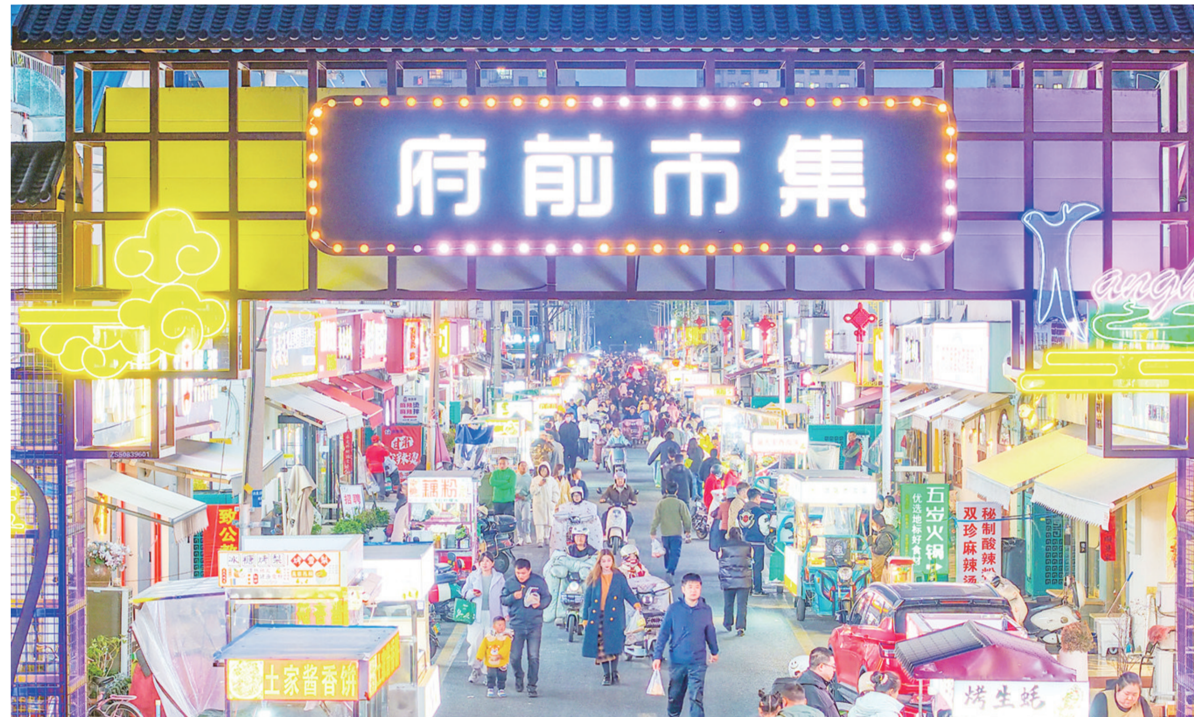
暮色下的府前市集霓虹璀璨,游人如织,“夜经济”红火。