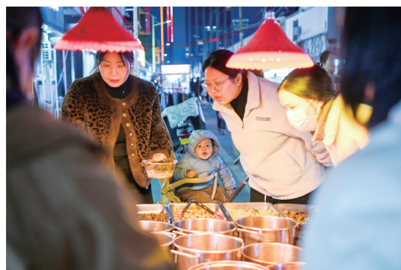
街头巷尾遍布市井美食,引市民争相购买。