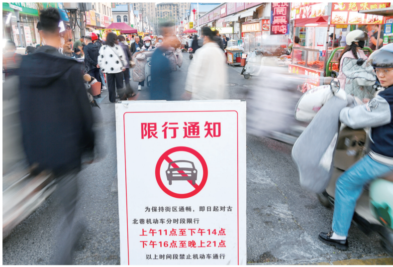
古北巷实施分时段限行管理,保障街区通行秩序。