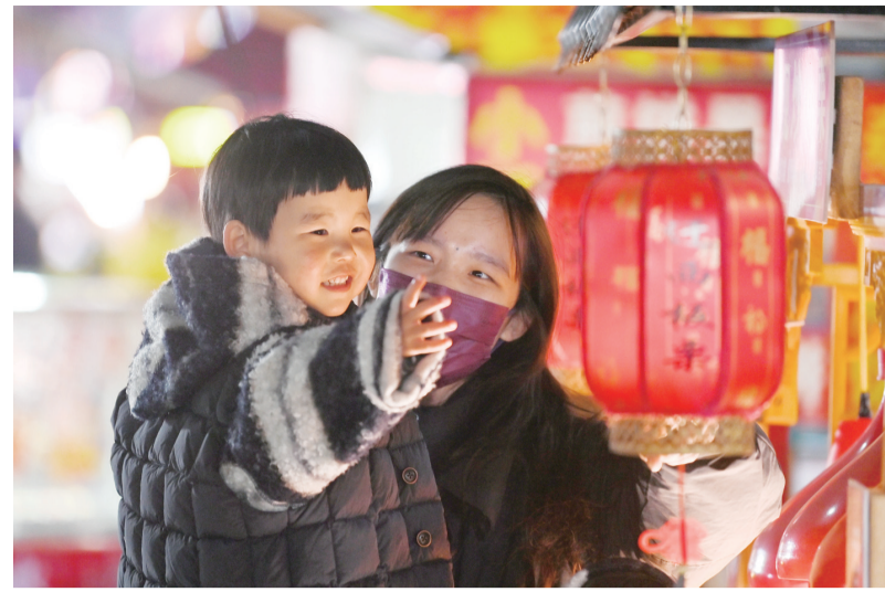
改造后的微景观吸引市民驻足打卡。