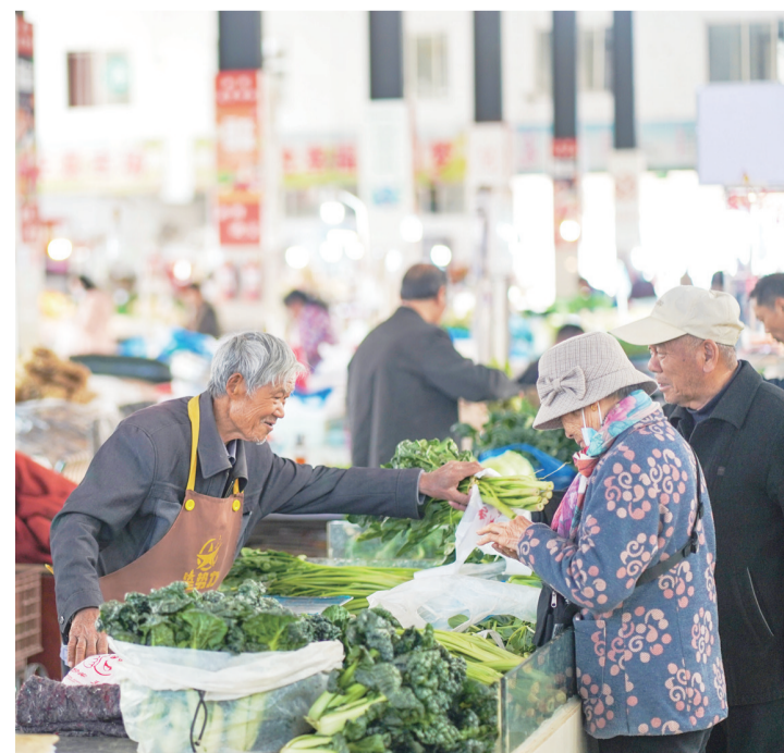
府前菜场设置自产自销区域,以供菜农、果农在市场内规范经营。