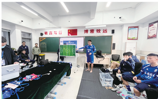
苏宿工业园区队赛后复盘