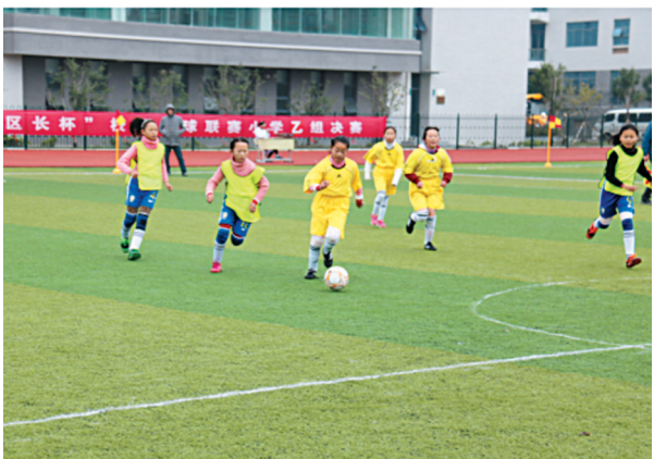
11月26日,盐都区第二届“区长杯”校园足球联赛在高新区小学和郭猛实验学校圆满落幕。本届联赛分小学甲组、乙组,初中组和高中组四个组别进行,参赛人员均为全区中小学生在读学生。图为小学乙组比赛现场。

近年来,秦南镇泾口村坚持“高效农业特色化、特色农业规模化、规模农业产业化、农业产业外向化”的发展理念,不断调整、优化农业产业结构,鼓励发展绿色、生态、高效农业,走出了一条现代化特色农业发展之路。截至目前,泾口村现代农业种植面积已经超过1500亩,有效地促进了农民增收致富。