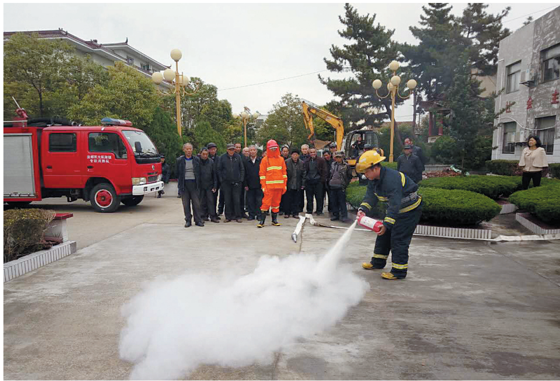
连日来,大纵湖镇积极开展消防安全“进企业、进社区、进学校、进单位”活动,组织人员广泛宣讲日常消防安全知识,详细讲解消防器材使用方法,全面提高居民消防安全意识。图为镇消防队员正在敬老院为老人讲解示范扑救初期火灾演练场景。