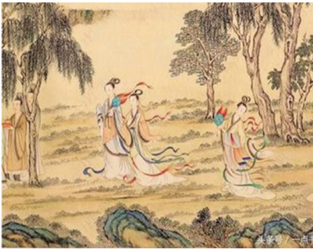
《洛神赋图》是东晋顾恺之的画作，全卷分为三个部分，曲折细致而又层次分明地描绘着曹植与洛神真挚纯洁的爱情故事。人物安排疏密得宜，在不同的时空中自然地交替、重叠、交换，而在山川景物描绘上，无不展现一种空间美。