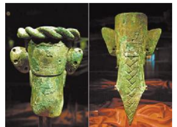
三星堆辨发(左)和髻发(右)的青铜头像

其中，石峁遗址的石壁上隔几米就装饰有菱形的石雕眼睛图案，与三星堆器物坑发现的可能是钉在墙上的铜眼睛，有着同样的意趣。“神木石峁遗址时期略早于三星堆，杨官寨遗址就更早了。这也说明，一些文化和器物形象并非是凭空产生的，可能有其渊源。”孙华指出。（源自《人民网》）