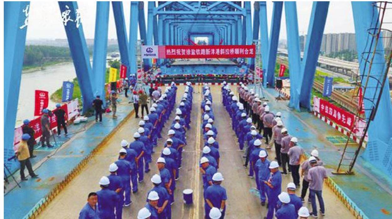
8月25日上午10时18分,随着最后一块热轧不锈钢复合桥面板在70吨桥吊吊机的工作下精准嵌入,国内跨度最大双线高速铁路钢桁斜拉桥——徐盐铁路跨新洋港斜拉桥钢桁梁成功对接,提前20天完成合龙。这标志着徐盐铁路建设取得突破性进展,也为徐盐铁路盐池段架梁铺轨施工奠定坚实基础。

在今年4月13日夜,美国联合英国和法国对叙利亚发动了导弹打击,共向叙境内发射了100多枚导弹,三国的目标都是与生产化学武器有关的设施。根据俄罗斯国防部的消息,叙利亚军队的防空导弹系统共拦截了全部103枚导弹中的71枚。来源:环球网