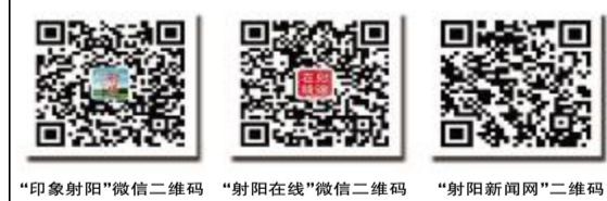
“印象射阳”微信二维码 “射阳在线”微信二维码 “射阳新闻网”二维码

“我们建设新农村不但不讲旧貌换新颜,更要留住传统文化的根。”日前,海河镇农耕博物馆负责人自豪地说,“如今很多人都喜欢来这休闲参观,尤其是放学后,附近的不少学生就自己过来参观或者在馆内的图书室看书学习,了解农耕文明知识。”许多人都向往农耕生活,这里有静谧的环境,丰富的农耕文化珍藏品。游客们徜徉在这里放松心情、纾解心中乡愁的同时,还能够更深刻地了解传承农耕文化。