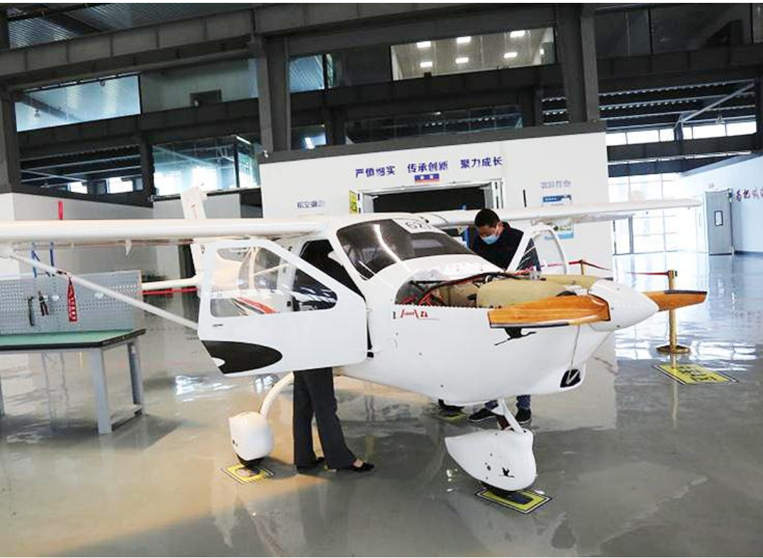
位于射阳经济开发区航空装备产业园的中澳航空公司是集飞机整机生产、航空发动机生产、通航运营、航空培训为一体的全产业链航空企业,是全国第二家取得飞机整机生产许可证的民营企业,可年产航空发动机100台、飞机50架。图为企业生产车间一角。

一项项务实举措的推进,一个个绿化提升工程实施,一个绿色、美丽、幸福的射阳已呈现眼前。今年,我县继续加快绿色射阳建设步伐,压实工作责任,创新工作方式,着力实施“1366+”工程,重抓规模造林,全面打造生态和谐射阳。