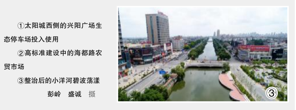
①太阳城西侧的兴阳广场生态停车场投入使用 ②高标准建设中的海都路农贸市场 ③整治后的小洋河碧波荡漾

近年来,我县大力实施民生实事工程,在公共卫生、文化教育、医疗卫生、交通出行等方面,不断提高人民群众的满意度和幸福感。