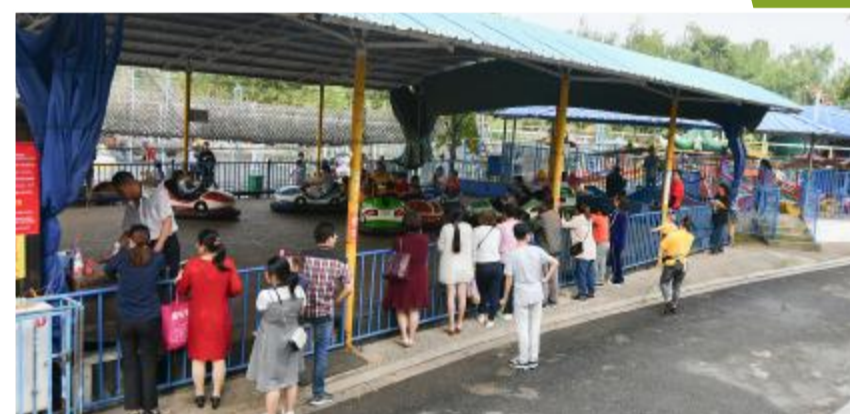
游客在后羿公园里游玩