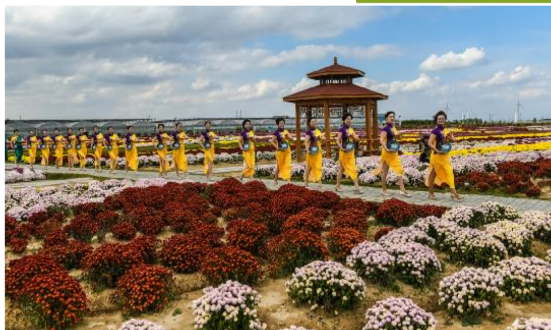
美不胜收的鹤乡菊海现代农业产业园