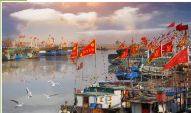
孕育了丰厚的渔民文化和多彩渔港风情的旅游胜地黄沙港