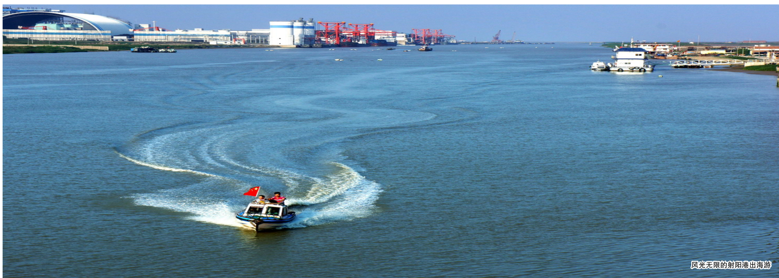
风光无限的射阳港出海游

近年来,我县依托独特的生态资源和海涂风光,以“水绿生态、鹤乡射阳”为定位,以发展全域旅游为方向,积极促进旅游产业与城乡建设、工业农业、文化教育等融合发展,强势推进旅游规划、项目建设、品牌提升等各项工作,初步形成旅游高质量发展的格局。