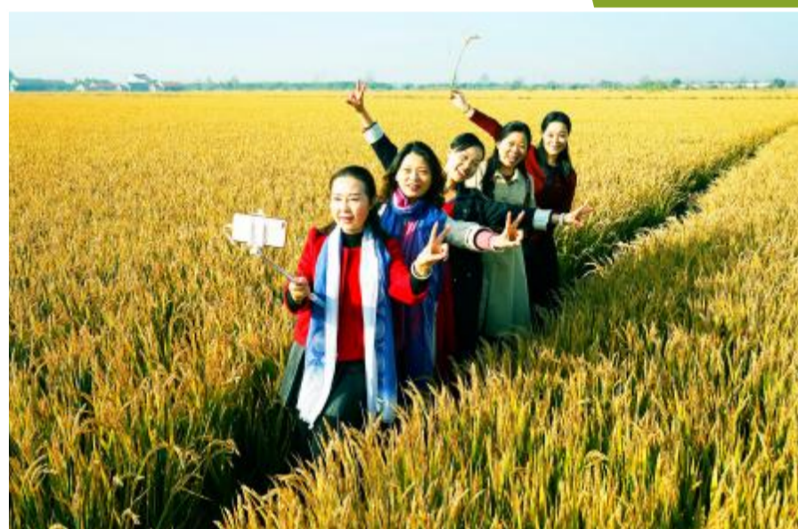
引领新风尚的乡村游