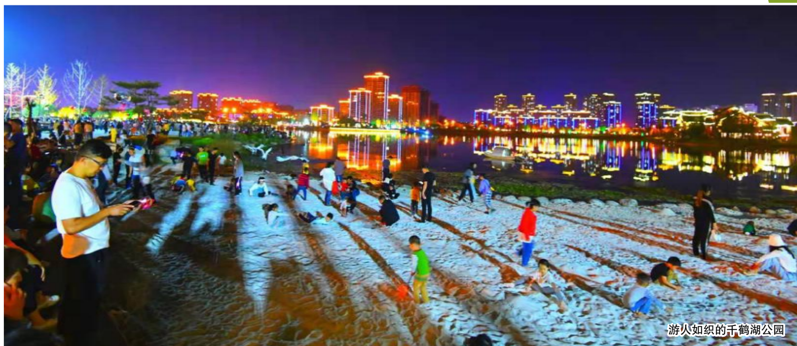
游人如织的千鹤湖公园