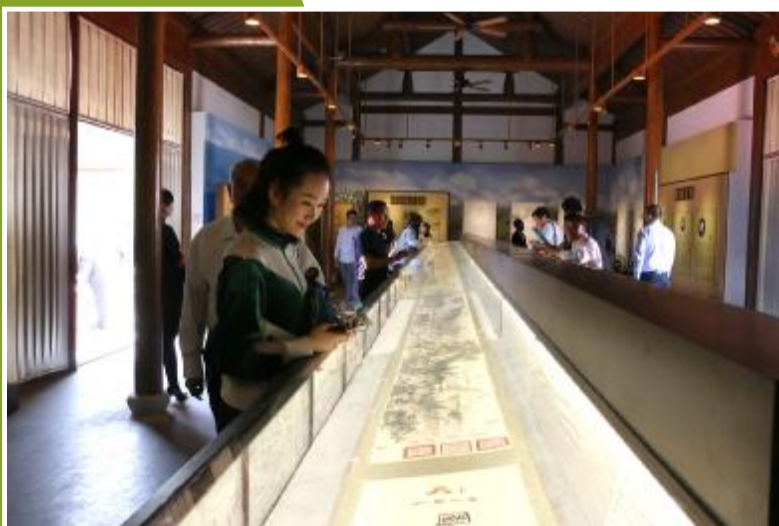
游客参观集中展现盐阜地区从古至今的农耕与变迁的海河农耕博物馆