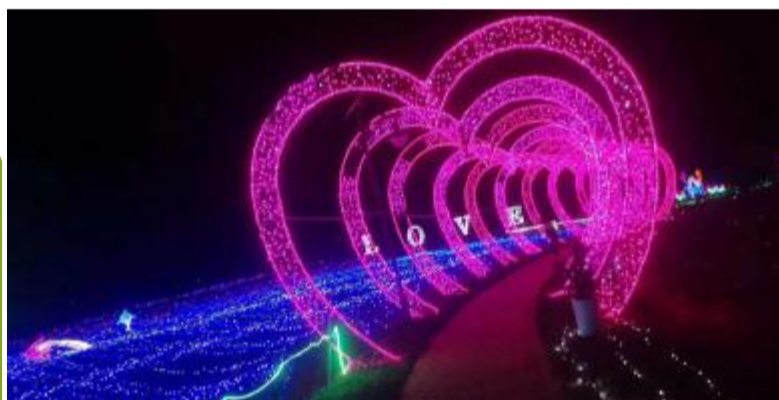
阳河湾音乐梦幻灯光节让游客大饱眼福

正值国庆,秋高气爽,鹤乡大地进入一年中最美的时节,同时也步入旅游黄金季。在鹤乡众多旅游景点中,有让梦想起航的射阳港码头、有千娇百媚的洋马菊花、有风光旖旎的千秋阳河湾、有红色旅游基地华中工委纪念馆……处处“醉”美风光,让游客邂逅最浪漫的秋天!