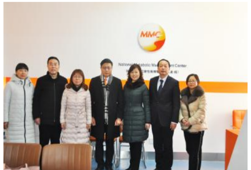
彭永德教授、石建霞教授等与县糖尿病医院工作人员合影

2020年2月2日(农历正月初九)上午8:30,“长三角糖尿病联盟”主席、内分泌科博士研究生导师彭永德教授,石建霞教授团队将来县糖尿病专科医院“彭永德名医工作室”,为糖尿病、甲状腺疾病、骨质疏松症及各种内分泌疑难杂症患者诊治。(联系人:戴女士,电话:18761261881)