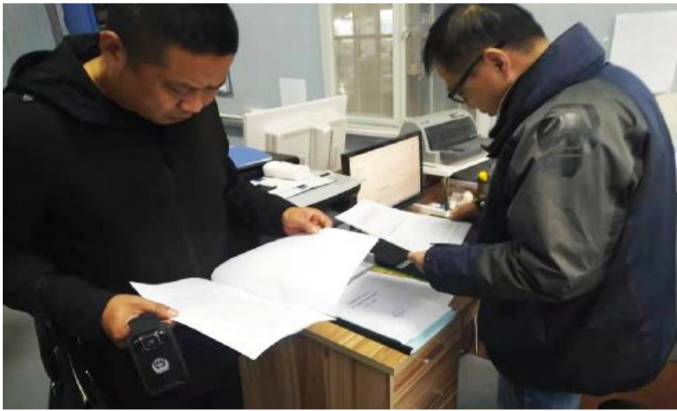
射阳生态环境局执法人员检查企业台账资料。

我县还把共建美好家园作为生态文明建设的重要内容,制订“建设美好家园”行动计划,重点推进一批生态文明建设龙头工程,实施生态源保护、城市公园绿地、城镇绿地、生态廊道、生态绿道和生态细胞建设。通过开展美丽乡村建设和农村环境综合整治,逐步推进乡村生活污水治理设施全覆盖,实现城乡生态建设一体化。