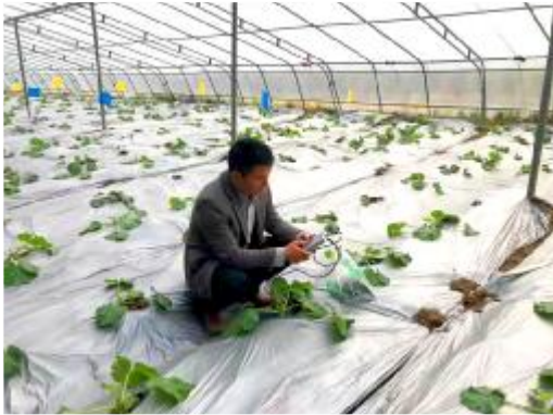
近年来,我县牢牢把握农业增产、农民增收工作总基调,强势推进农业结构调整,大力发展设施农业,全县农业发展呈现出稳中向好的喜人局面。 上图为种植户在修整草莓藤蔓。 左图为农技专家在检测土壤酸碱性。