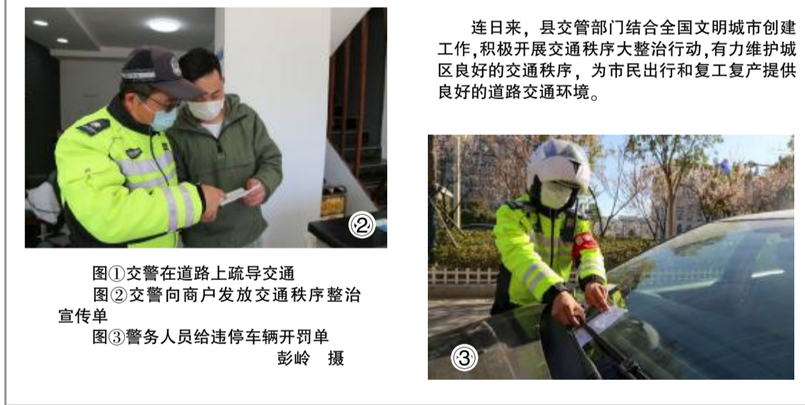
图①交警在道路上疏导交通 图②交警向商户发放交通秩序整治宣传单 图③警务人员给违停车辆开罚单

连日来,县交警部门结合全国文明城市创建工作,积极开展交通秩序大整治行动,有力维护城区良好的交通秩序,为市民出行和复工复产提供良好的道路交通环境。