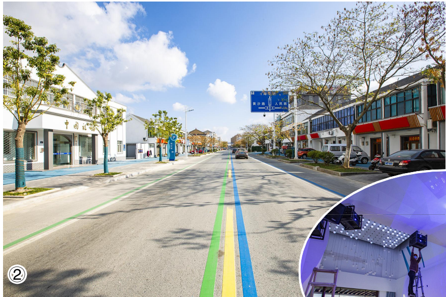
①渔港小镇俯瞰图 ②焕然一新的鱼跃大街 ③内部装修有序进行

连日来,我县进一步健全要素保障、一线推进、服务协调等机制,扎实推进黄沙港渔港小镇建设,努力打造黄海之滨旅游目的地,为射阳高质量发展贡献力量。