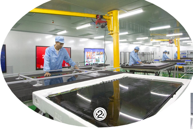
图①为电子信息产业园全景。 图②为可年产8万台液晶显示单元的汇宇明景生产车间。 图③为总投资10亿元的江苏天谷数字信息产业发展有限公司生产车间。

近年来,我县将电子信息产业作为支柱产业进行重点培育,持续加大项目招引力度,不断拓展产业链条,电子信息产业实现从无到有、从输血到造血,从单个项目到产业集聚、从分散经营到园区集群、从低端制造到产学研一体化的重大转变,产值年增幅保持在30%以上,预计到今年年底产业规模将超过70亿元。