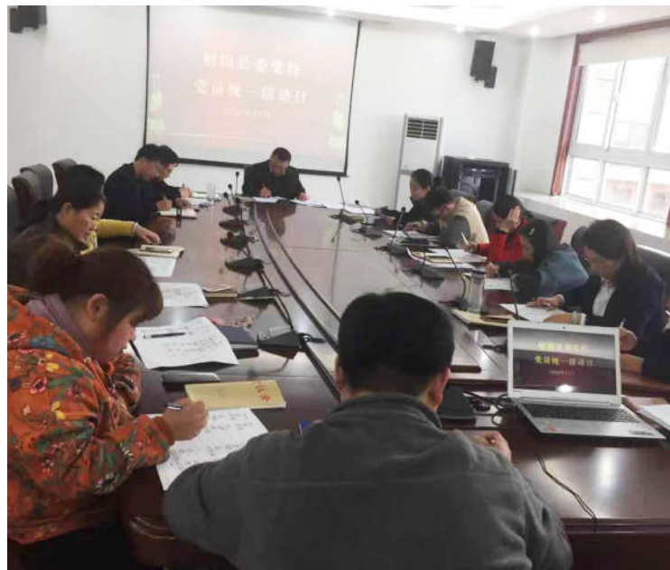
连日来,县委党校采用集体学习、自主学习相结合的方式,迅速掀起学习党的十九届五中全会精神热潮。图为日前该校党总支开展的以考促学活动现场。