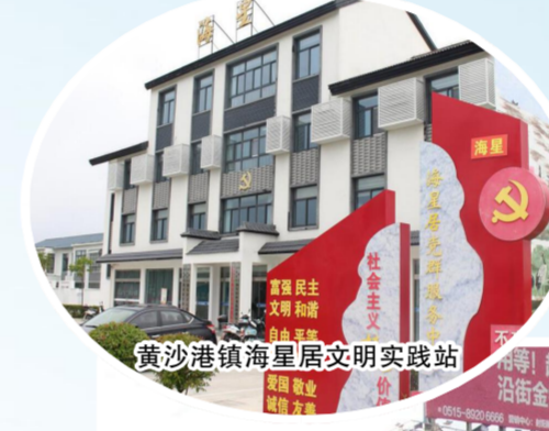
黄沙港镇海星居文明实践站