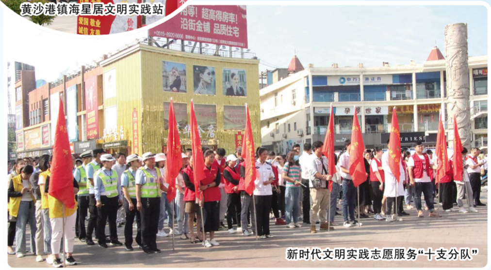
新时代文明实践志愿服务“十支分队”