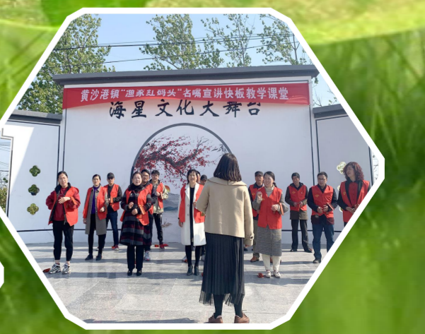
“渔家红码头”志愿服务项目