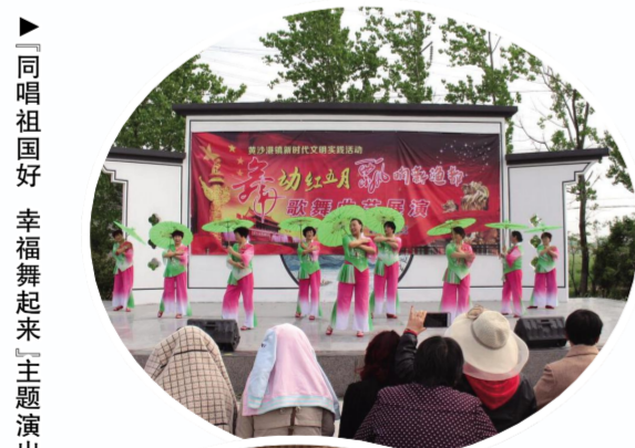
同唱祖国好 幸福舞起来 主题演出

推行群众点单、县镇配单、中心派单、团队接单、群众评单闭环服务模式。2020年累计收集群众需求56200多条。按照“一月一主题”要求,截至2020年11月底,开展“好家风好家训好家规和好婆婆好妯娌好邻居”“清明祭英烈”“文明实践·好人同行”等活动1.4万场次。全县发掘培植4968户“文明实践中心户”。