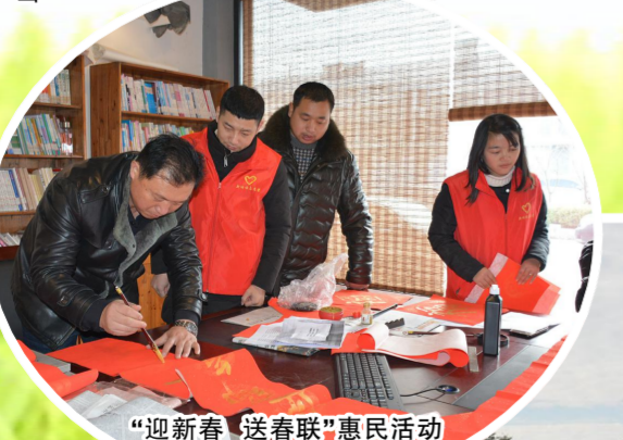
“迎新春 送春联”惠民活动