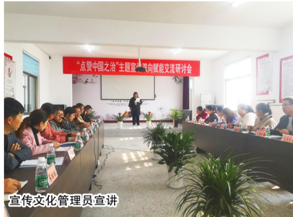
宣传文化管理员宣讲