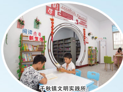
千秋镇文明实践所

整合基层党群中心、综合文化服务中心等阵地设施,统筹党政机关、企事业单位、社会组织等,建立涵盖2143个载体的10类平台。建成开放县志愿者活动中心,组建志愿组织931个,活跃志愿者14.5万人。智慧云平台上线运营。