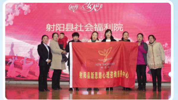
新思路心理咨询服务中心