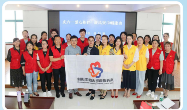
射阳巾帼志愿服务队