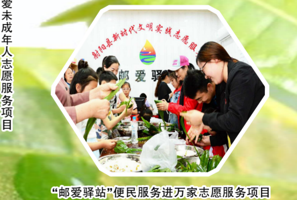
“邮爱驿站”便民服务进万家志愿服务项目