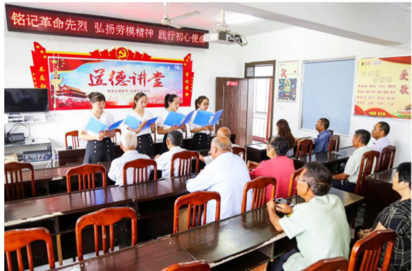
“铭记革命先烈 弘扬劳模精神 践行初心使命”道德讲堂宣讲