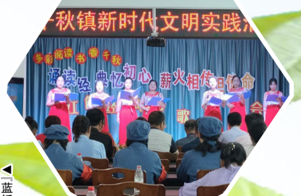
“文明实践 周二有约”志愿服务项目