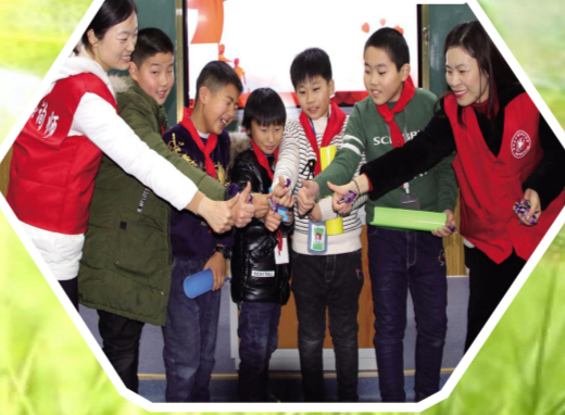
“精点子”一站式扶贫志愿服务项目