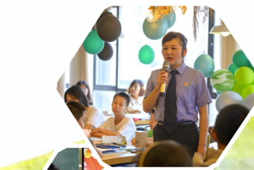
“非常5+1”困境儿童精准教育志愿服务项目

将活动内容项目化,以争创“示范所(站)”“品牌项目”“示范课堂”“先锋队”等四个先锋示范为抓手,全县形成“农民小课堂”“渔家红码头”等45个特色项目。在第五届省志交会上,“蓝纸鹤”项目获银奖,受到中宣部副部长傅华等领导肯定。