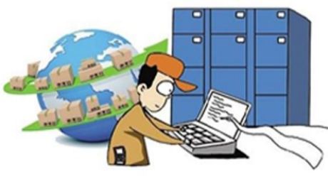
完成65个社区智能投递终端“E邮柜”建设