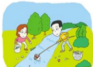
完成8公里河道综合整治