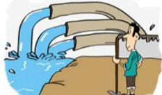
新增污水管网40.2公里