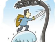
完成建设106个农村生活污水治理村