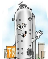
淘汰燃煤小锅炉214台