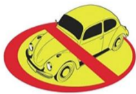
淘汰黄标车90辆,完成考核任务的120%