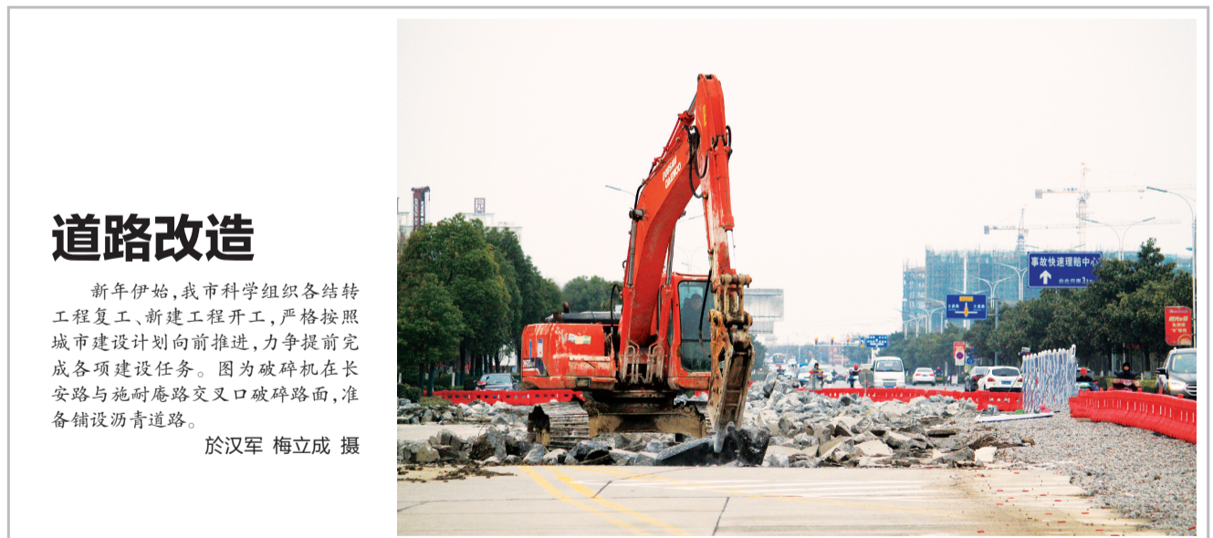
道路改造