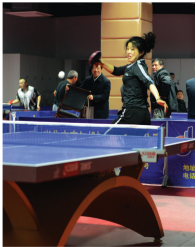
2月17日,第二届“和谐杯”乒乓球团体友谊赛落幕。

本报讯(全媒体记者 陈华 通讯员 张敬)日前,位于千垛镇的兴化市桂敏服饰有限公司负责人蒋敏,向该镇20户贫困户家庭赠送爱心棉被。 “感谢爱心人士对我们的关怀。”当工作人员手中接过厚厚的棉被时,刘大妈感动得热泪盈眶,她说家里的棉被旧了,原本还想着近期去买条棉被,没想到爱心人士还送来了这么好、这么厚实的棉被,这些棉被来得真是及时。