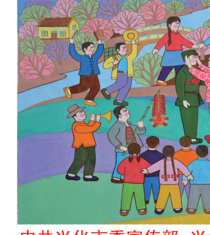
中共兴化市委宣传部 兴化市新闻信息中心 宣