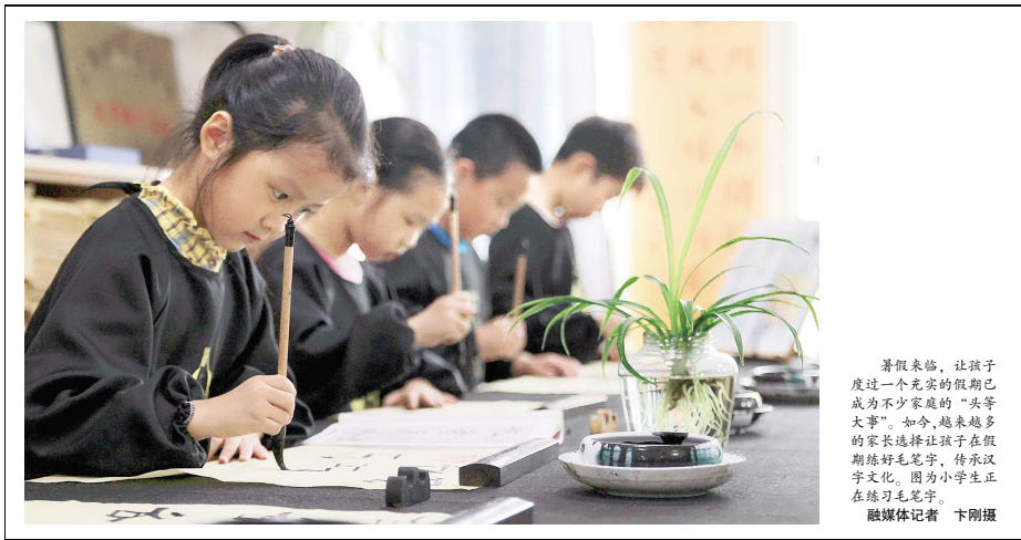
暑假来临,让孩子度过一个充实的假期已成为不少家庭的“头等大事”。如今,越来越多的家长选择让孩子在假期练好毛笔字,传承汉字文化。图为小学生正在练习毛笔字。