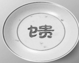
大地馈赠 拒绝浪费