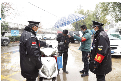
2020 年 2 月 15 日,县纪委的志愿者在鹏胜家园小区开展疫情防控防控工作。