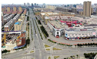
2020 年 2 月 6 日,盱眙县城区大街小巷因为疫情防控几乎无人上街,城市显得格外安静。