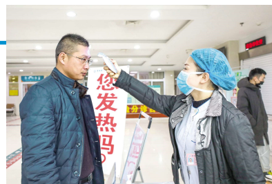
2020 年 1 月 28 日,盱眙县人民医院工作人员正为进入医院的每一位市民测量体温。