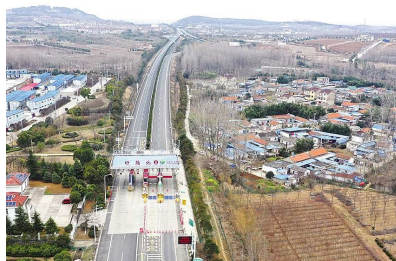
2020 年 2 月 6 日,盱眙高速公路北出口因为防控新型冠状病毒肺炎而封闭。