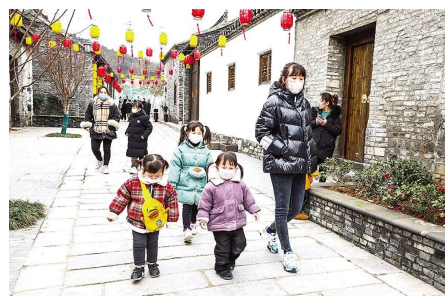
2020 年 1 月 25 日(农历大年初一),城北老街上的男女老少全部戴上了口罩,预防新型冠状病毒肺炎。