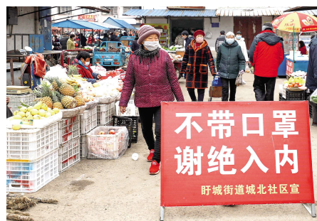
2020 年 2 月,市民们都主动戴上口罩出入菜市场。