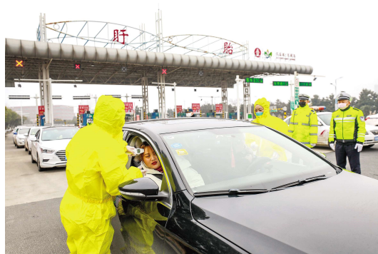
2020 年 1 月 28 日,盱眙高速出口,疾控工作人员正在为进入盱眙的车辆驾乘人员检测体温。