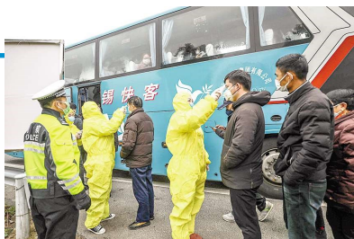
2020 年 1 月 28 日,盱眙县疾控中心工作人员正在高速盱眙出口为乘客测量体温。