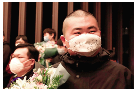
2020 年 3 月 17 日,淮安市援鄂医疗队员圆满完成任务归来,一名医生口罩上写着:中国必胜!