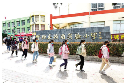
2020 年 4 月 17 日,盱眙县城南实验小学的学生们放学了,与以往不同的是,他们都带着口罩。