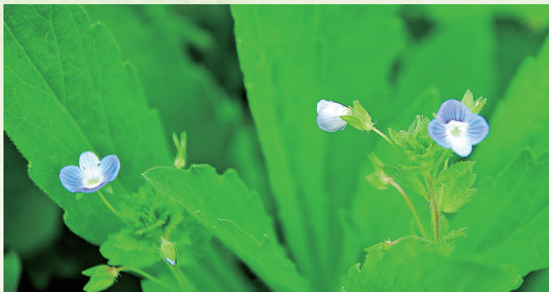
青葱 盛利者 摄

人潮汹涌,各自漂流,各有渡口,各有归舟。我们都在为生活奔波,工作、家庭、社交……这些琐事占据我们的时间和精力,大家很难关注周围,从而忽略了身边的美好。事实上,孤独原来是人生的常态,你我不例外,大家常为此忧伤和忏悔。这本书告诉我们:生活中的美好往往隐藏在那些琐事中,只要我们用心发现,用心感受,孤独可以让人心灵变得清明,超然自省,复原心灵的伤口,发现生活其实充满美好——一路云淡风轻,活得从容自在。