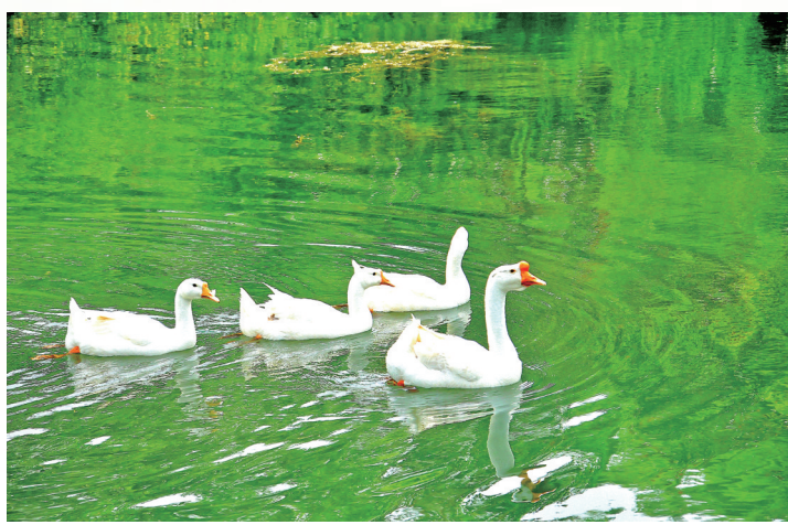
一池春水 盛利者 摄