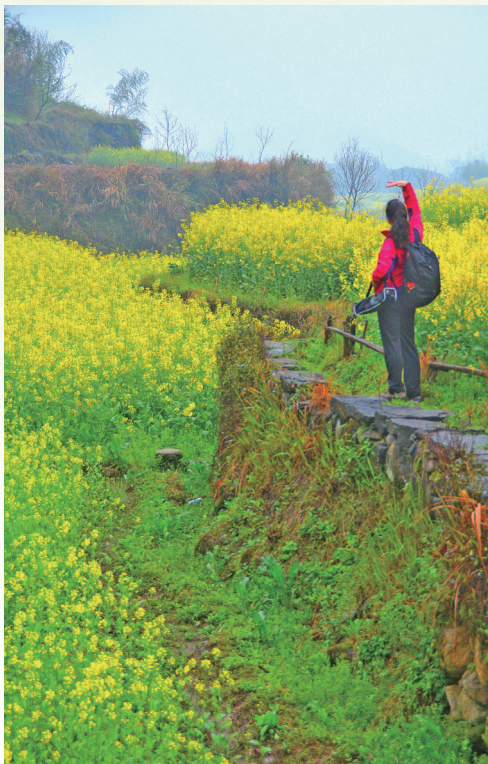
春野雨蒙蒙