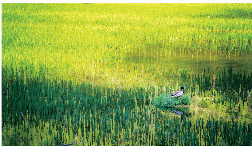
绿水清波映画来