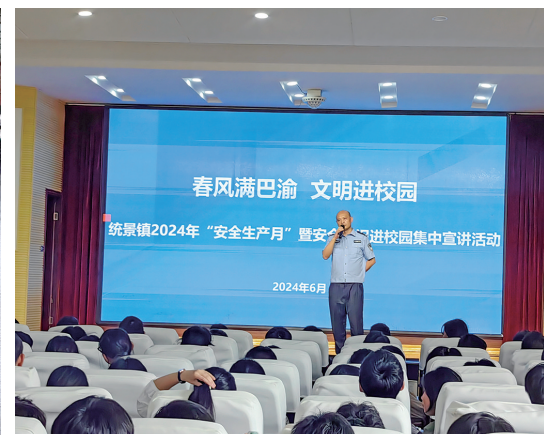
民警向师生普及法律知识