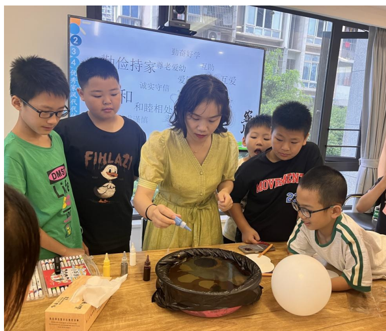
社区志愿者带领大家调制漆扇颜料

导孩子们主动分享自己最喜爱的书籍。绘本故事让孩子们非常喜欢,大家高兴地分享读书的快乐。工作人员和老师还向小朋友们分享了阅读的重要性,阐述了良好的阅读氛围环境对孩子成长的重要性,讲解了开展阅读的方式和技巧,培养孩子良好阅读习惯,做好儿童成长引路人、守护者、筑梦人。