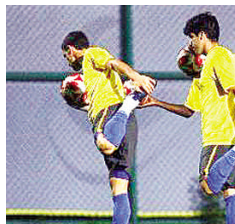
巴西男足酷似一群翩翩起舞的“小天鹅”。