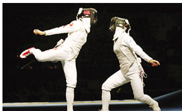
击剑场上的选手像是在跳“恰恰”。