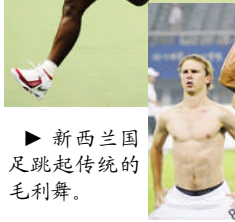
新西兰足球运动员跳起传统的毛利舞。