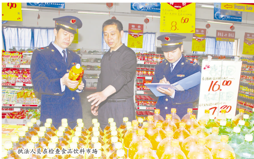
执法人员在检查食品饮料市场

基层建设 按照小局大所、精局强所的思路和模式,强化基层监管力量配置,推动监管重心下移,推行基层与机关的双向交流。近年来,基层建设力度逐年加大,从 2000 年起,先后新建了秦南、郭猛、尚庄、龙冈、大纵湖、楼王工商分局办公楼、食堂、活动室;办公自动化步伐加快,局里累计投入 100 多万元,添置了执法车辆、传真机、数码相机、食品检测箱等。2006 年起,8 个基层分局全部获评区级文明单位,有 2 个分局被评为市级文明单位,1 个分局被评为省级文明单位。