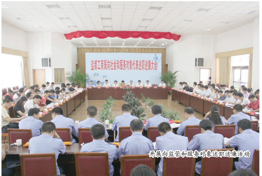
开展向监管和服务对象述职述廉活动

学法培训 以“五学五促”为主要内容的多种形式的业务培训和化学学习,注重业务素质提升。近十年,在省市工商局组织岗位练兵和技能竞赛中有 12 人(次)获得省市第一名,26 人(次)进入前三名。目前全系统大专以上学历 138 人,其中本科以上学历 61 人,分别占总人