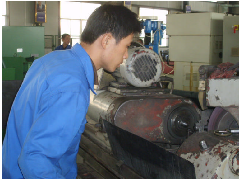
9月份,江苏驰翔精密齿轮有限公司投入520万元,引进YK73125数控蜗杆磨齿机,磨齿加工直径1.5米的齿轮,可年新增销售550万元。图为工人们正在加班加点生产齿轮,开展“百日竞赛”活动。