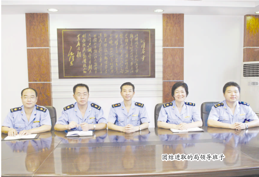
团结进取的局领导班子

盐都工商局服务对象共有各类企业 5880 户,个体工商户 16395 户,农民专业合作社 40 户,各类市场 40 个。1993 年、1995 年、1997 年连续 3 年被评为全省工商系统先进集体;1997 年,被评为全国工商系统先进集体、全国保护消费者权益先进集体;2000 年,被评为全国青少年优秀维权岗;2003 年,被评为江苏省文明行业;2004 年,被市委表彰为“三个文明建设”先进典型;2005 年,被盐城市委表彰为优秀党组织;2008 年,被评为江苏省文明行业,盐城市文明单位;2004 年、2006 年,被市工商局表彰为“红盾优胜先进集体”;连续 3 年被区委、区政府表彰为“三个文明”建设综合先进单位;连续 5 年在地方行政形象和效能建设社会测评中名列区直部门前五,受区委表彰。