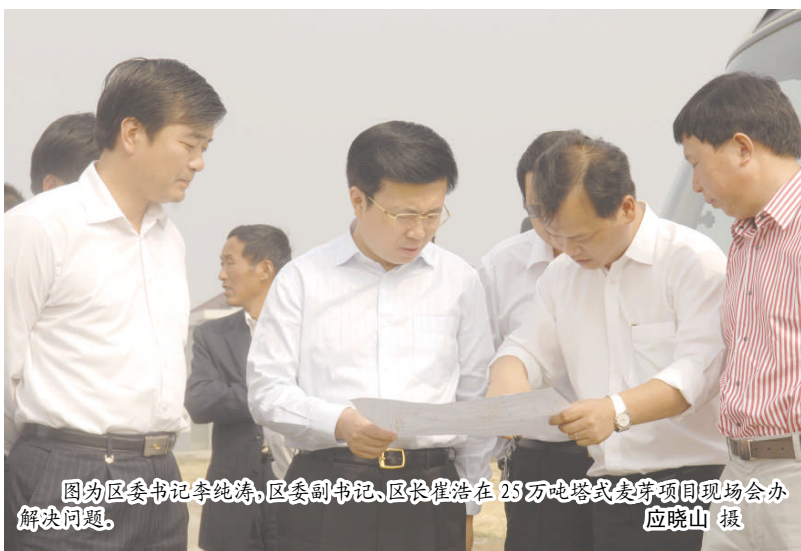
图为区委书记李纯涛，区委副书记、区长崔浩在25万吨塔式麦芽项目现场会办解决问题。

李纯涛指出，新金威集团的系列目标，不仅关系到该集团在盐都企业的发展壮大，也必将为地方经济发展作出更大贡献。我们要针对集团的系列目标，采取系列化的服务措施，把每一项服务工作具体化，紧密配合项目建设和单位，同心协力加快新上项目的开工建