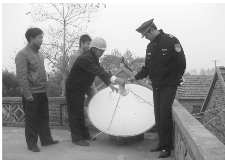
连日来,楼王镇组织广电站、派出所、工商分局、司法所等部门工作人员,深入到全镇17个村居,逐村逐组逐户进行拉网式排查,并集中整治取缔“小耳朵”。至目前,该镇已强制拆除非法卫星电视通信天线49座,群众自行拆除153座。

入”等办法,积极筹集“爱心超市”运转资金;通过“每月定额、自由挑选、免费领取”的救助模式,以每户每月20元的标准,向全区低保户、五保户和部分贫困户定额免费发放粮油等生活用品。据统计,“爱心超市”每年向全区3900多户低保户、3300多户五保对象和部分贫困户发放生活用品价值达150多万元的,有效改善了他们的生活。(陈桂庚 陈恒林)