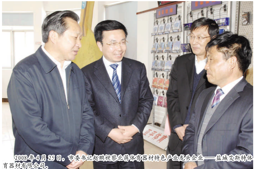
2008年4月25日,市委书记赵鹏视察北蒋镇体育器材特色产业龙头企业——盐城艾斯特体育器材有限公司。

环境质量明显改善。2004年,创建成区级卫生镇,2007年,创建成市级卫生镇,今年可望创建成市级环境优美镇。自去年以来,全镇实施了二十八件社会事业实事工程,先后硬化建成了文昌路、朝阳西路、弘文路,新装、改装了集镇所有路灯,建成了盐金路景观一条街,新建2座水冲式公厕、15座垃圾房和垃