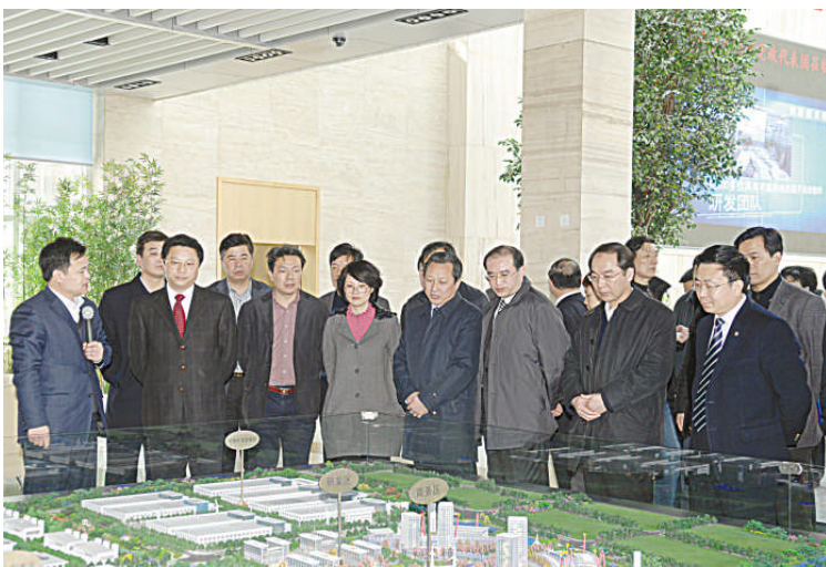
图为杨卫泽与无锡党政代表团成员参观华锐风电规划展示厅。

随后,代表团一行来到江苏华锐风电产业园,参观了华锐风电科技(江苏)有限公司的规划展示厅、生产车间,听取了产业园区建设和该公司运营情况介绍。杨卫泽对我区抢抓沿海开发机遇、加快发展风电装备制造的做法表示赞赏。(李金宝 应伟)