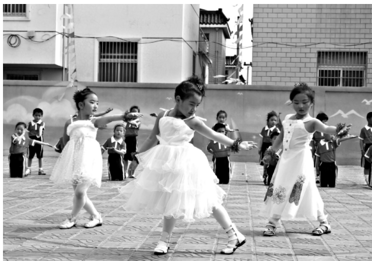
北龙港镇中心幼儿园十分重视幼儿智力开发,注重培养动手动脑能力,坚持寓教于乐,提高幼儿小朋友的全面素质,促进小朋友健康快乐成长。图为该园5月31日组织小朋友载歌载舞,与家长们一起庆祝“六一”国际儿童节。

5月24日,楼王镇文昌居委会300亩大棚蔬菜项目现场,工人们热火朝天地忙着建冷库。这是该镇继1000亩蓖麻生态种植、200亩菊花项目之后,引进的又一个高效农业项目。 今年以来,该镇着力推进“高效农业突破年”,全力组织农业招商,在盐金线重点培植特种水产品、大棚蔬菜、特种经济作物等三大产业,全镇高效农业取得了新突破,初步形成了7个高效农业示范点。据了解,镇17个村居均流转50至100亩土地,组建村组干部示范园,新上了蚕桑、莲藕等19个种养项目。公兴村5个村干部流转土地120亩,合资培育花卉苗木,既增加了干部收入,又为春季绿化提供了苗木。在村干部的带动下,该村又有5个农户流转了200亩土地,办起了3个育苗场。在不折不扣的兑现上级各项惠农政策的基础上,该镇出台了《推进高效农业的若干意见》,对获得市级以上名牌产品和知名商标等称号的,对农副产品进超市、进商场的,对列入市、区两级“双百”工程和高效设施农业项目的,均给予不同程度的奖励。对发展大棚蔬菜等设施农业的大户,按每亩3000元的标准给予扶持。 该镇还以龙头企业推动高效农业的发展,以俊盛淀粉公司为龙头,建成1万亩无公害小麦种植基地;以亿斤粮库及粮食精深加工项目为依托,带动农户种植无公害水稻2万多亩;以中英合资福源食品公司为载体,发展蔬菜种植1000亩。(沈杏凤 胡兴扣)