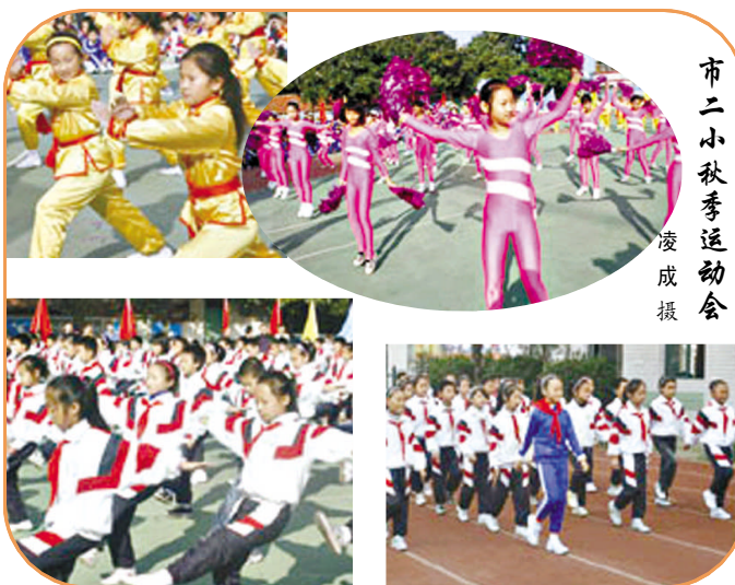
市二小秋季运动会

主办单位:区委宣传部 区文明办 团区委 区关工委 区教育局 投稿邮箱:YDNIME@163.COM