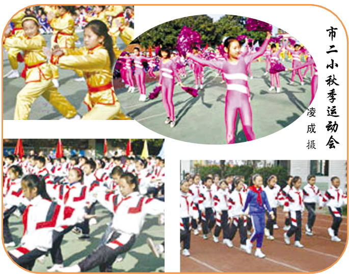
市二小秋季运动会

主办单位:区委宣传部 区文明办 团区委 区关工委 区教育局 投稿邮箱:YDNIME@163.COM